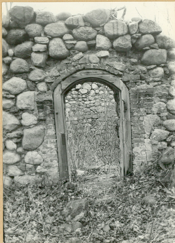
5. Drzwi w elewacji płd.