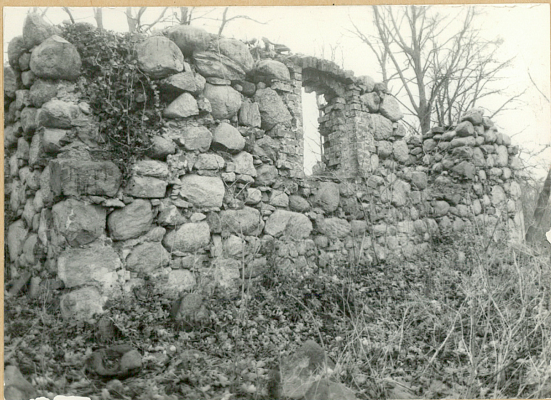
4. Elewacja wsch.