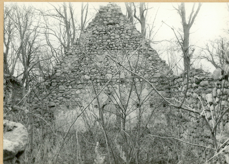
6. Widok wnętrza od wsch.