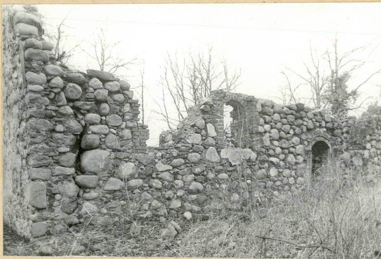
2. Elewacja płd.