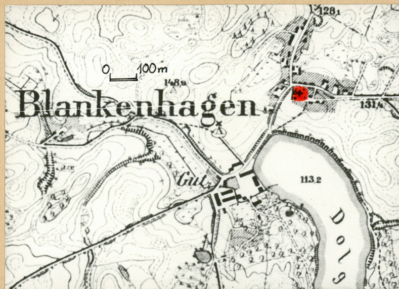
Mapka wsi z końca XIXw.

Elewacje. Elewacja frontowa płd. była 4-osiowa. Wejście umieszczone było asymetrycznie bliżej prawego narożnika /prezbiterium/. Na prawo od wejścia było jedno okno, a na lewo dwa okna. Wszystkie te otwory miały jednakowe łagodne łuki. Przeciwległa elewacja płn. miała tylko jedno okno - pośrodku. W elewacji zach. było tylko wejście osłonięte niewielką kruchtą - pośrodku. W elewacji szczytowej wsch. były dwa okna w przyziemiu rozmieszczone symetrycznie. Szczyt dachu z tej strony nie zachował się.