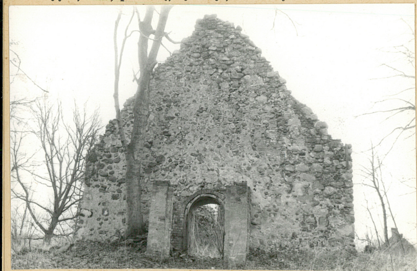
1. Elewacja zach.

10. Rejestr zabytków: Nr A-1108 data 30.10.1988