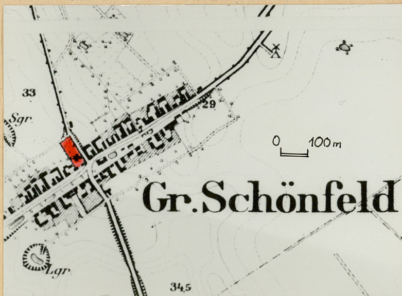
Mapka wsi z końca XIXw.

Wyposażenie i instalacje. W górnej części wieży zachowała się metalowa konstrukcja do zawieszenia dzwonów. Inne wyposażenie i instalacje nie zachowały się nawet w śladowej postaci.