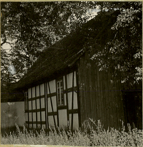
stan z 1964 r.