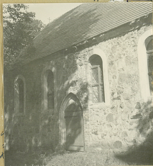
STAN z 1964r.