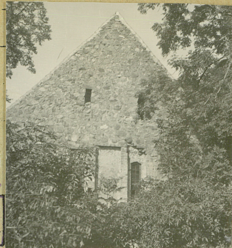
STAN z 1964r.

kościół orientowany. Od zach. wieści XVIII / XIX w. (obroniana). Kościół murewany z kamienia nanukowego z wieżami cegły. W ścianie pn. portek przypięty (zestęski) Okna dwukrotnie podkolumnie o gładkich gładkach. W ścianie zach. potrójne okno (trójkątne ramowane)