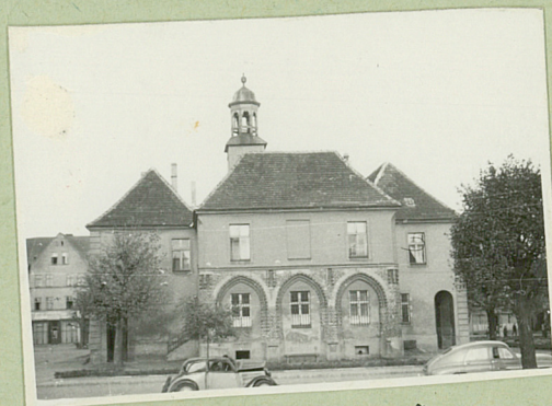
DIE BAU U KUNSTENKÄUER DER RL STETTIN BP IV NR 719