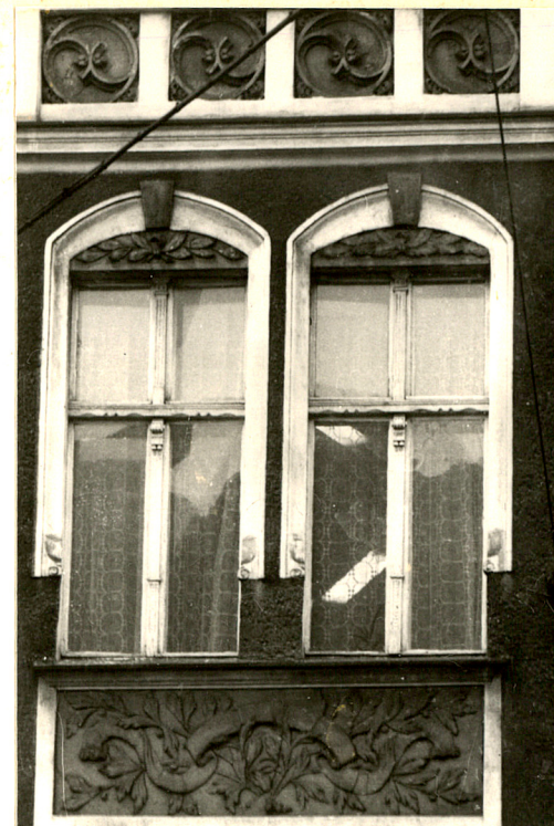
2. Okna ryzalitu trzeciej kondygnacji skrzydła zach.