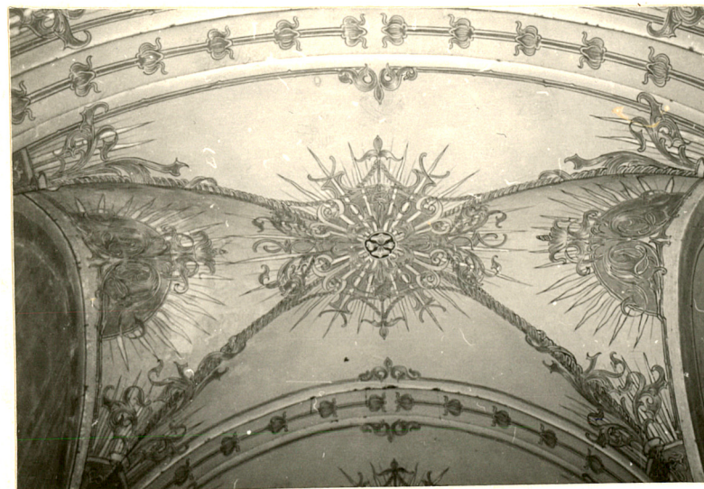
1. Sklepienie przejazdu skrzydła zach.

Instalacje . C.o., gazowa, wodno-kanalizacyjna, elektryczna.