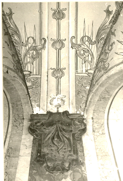
4. Fragment sklepienia przejazdu skrzydła zach.