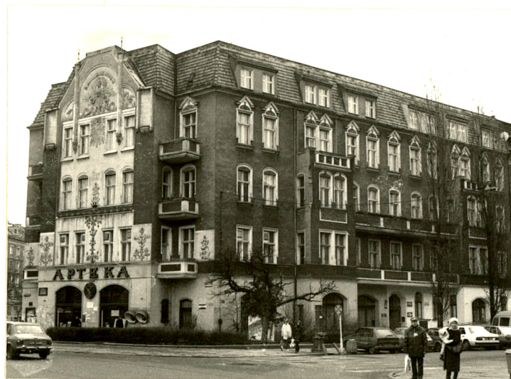
Widok elewacji półn. i zach.