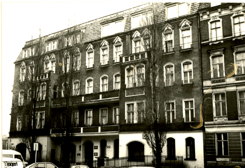
Widok elewacji zachodniej

11 Zdjęcia rzut, przekrój, sytuacja, orientacja