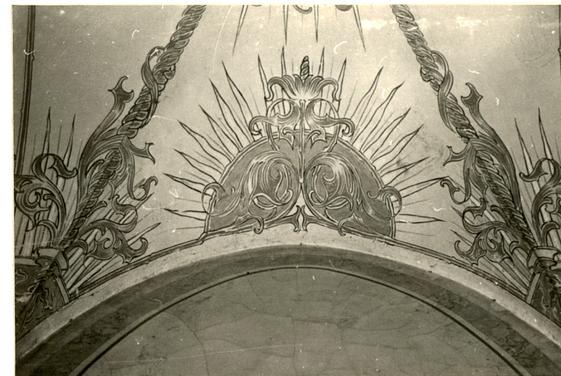
5. Fragment sklepienia przejazdu skrzydła zach.

Wkładkę założył: mgr Elwira Wolender, XII 1992 (imię, nazwisko, data)