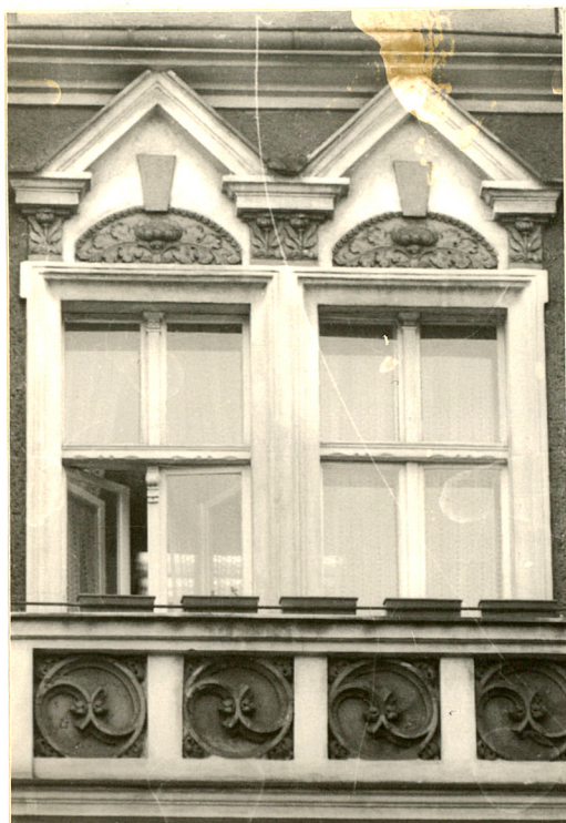
3. Okna ryzalitu czwartej kondygnacji skrzydła wsch.