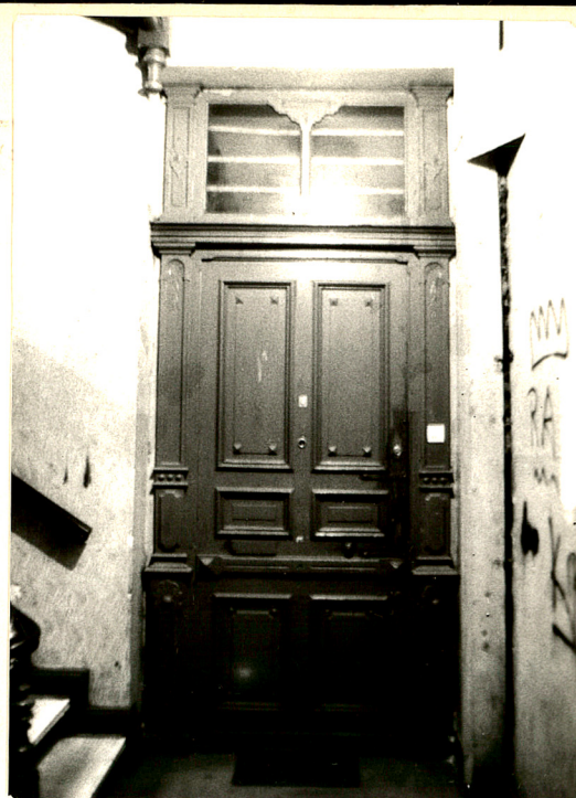
Drzwi wejściowe do mieszkań