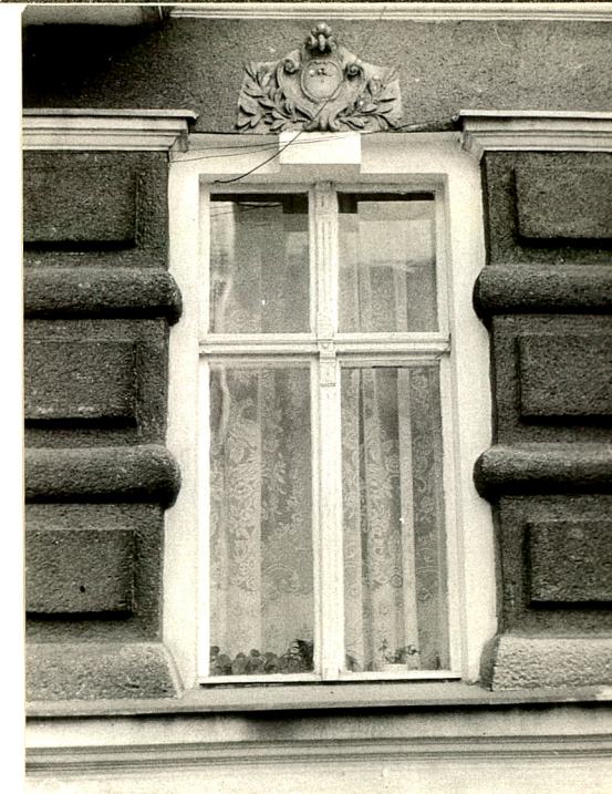
Okno I kondygnacji