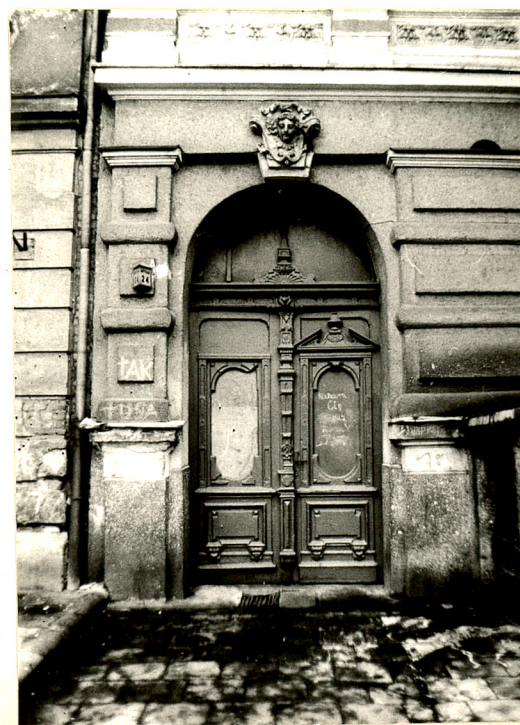
Wejście główne od ul. Śląskiej