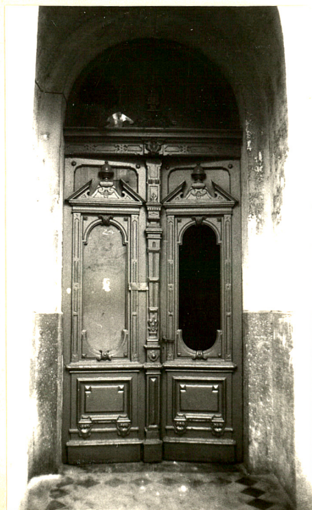
Wejście od str.pn.