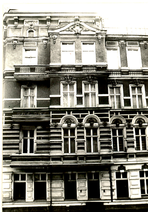
Wykusz elewacji pn.