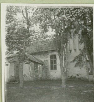
Widok strony ptdn.