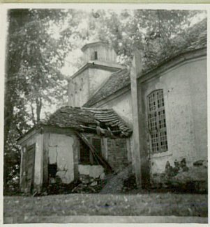
Widok od ptdn.