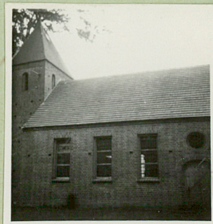
Widok od pŁdn.