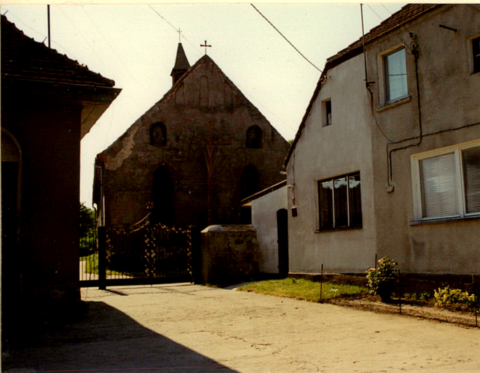
widok od wschodu

11. Zdjęcia, rzut, przekrój, sytuacja, orientacja