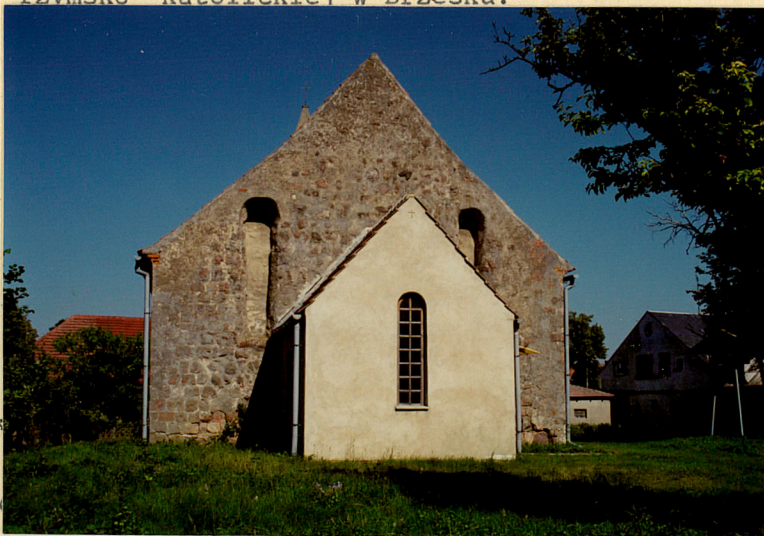
1. elewacja szczytowa, zach.

od udeżenia pioruna. W l. 1769-77 postawiono nową wieżę konstrukcji ryglowej, ośmiboczną z barokowym hełmem zwieńczonym latarnią, oraz odremontowano cały kościół. W l. 1829-33 po regulacjach gruntów w Letninie pozostała tylko własność chłopska i dobra sołeckie (104 ha). W 1868 r. kościół w Letninie miał 6580 talarów kapitału na utrzymanie kościoła, wieży, szkoły i plebanii. Wieś liczyła 409 mieszkańców. W 1871 roku kościół w Letninie został odremontowany: przemurowano okna w szczycie wsch. i elewacjach długich, zmieniono formę gotyckiego portalu w szczycie zach., elewacje zostały otynkowane. Pierwotną gotycką formę zachował jedynie ostrołukowy portal w ścianie płd. Z tego okresu pochodzą zachowane do dzisiaj: strop drewniany nawiązujący formą do sklepienia beczkowego, empora organowa i ławki. Do 1945 r. kościół w Letninie był kościołem filialnym ewangelickiej parafii w Brzesku. W 1945 r. w wyniku działań wojennych zniszczeniu uległa wieża. Z dawnego bogatego wyposażenia kościoła (Lemcke) zaginęły: krucyfiks z ambony z 1703 r., kielich srebrny pozłacany z 1698 r., patena srebrna pozłacana, 3 dzwony z 1743, 1744, 1762 r. z warsztatu szczecińskiego. Po wojnie kościół w Letninie został poświęcony 2 września 1945 r. jako kościół filialny parafii rzymsko-katolickiej w Brzesku.