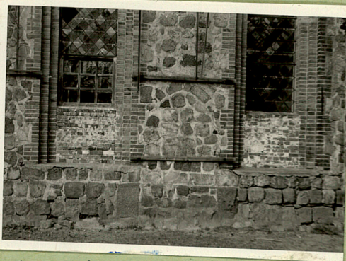
KOSCIÓŁ ORIENTOWANY SALOWY.