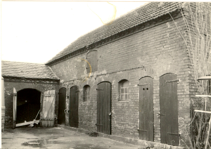
Widok na zabudowania gospodarcze