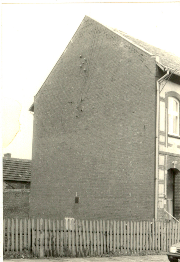
Elewacja boczna zach.