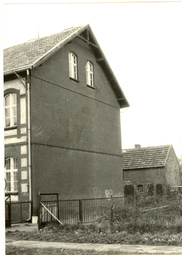
Elewacja boczna wsch.