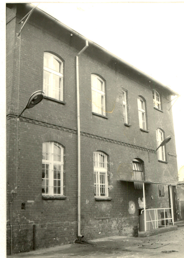
Elewacja tylna półn.