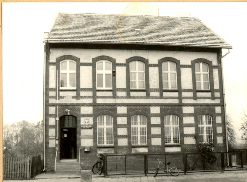
Widok budynku od strony połudn.