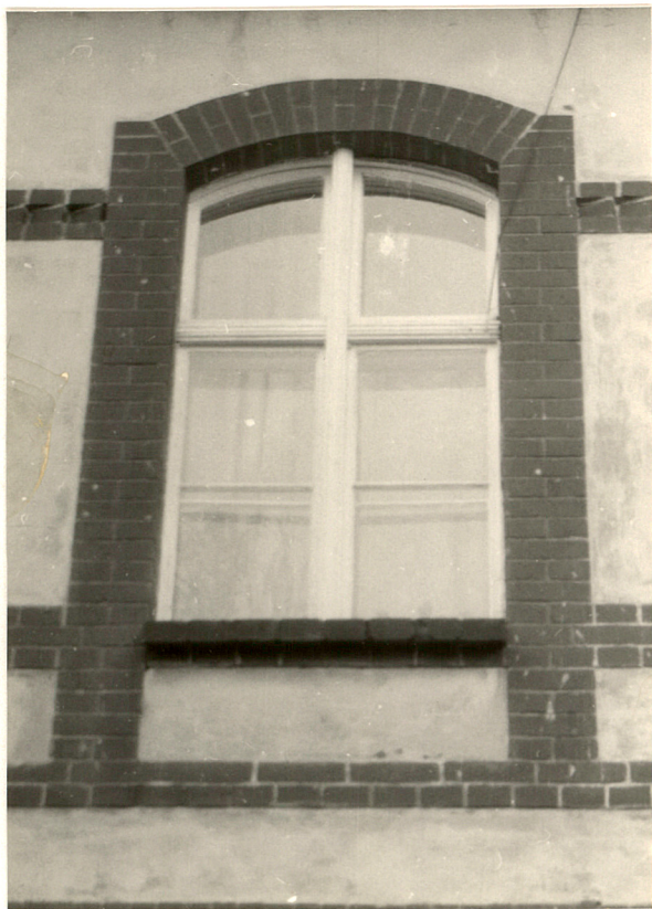
Okno elewacji frontowej