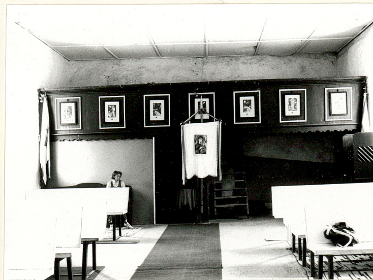
widok wnętrza w kierunku zachodnim