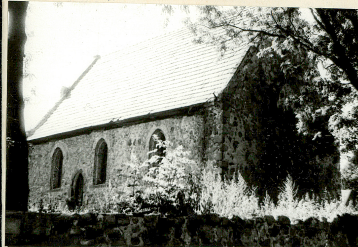
widok od strony północno-wschodniej

11. Zdjęcia rzut, przekrój, sytuacja, orientacja