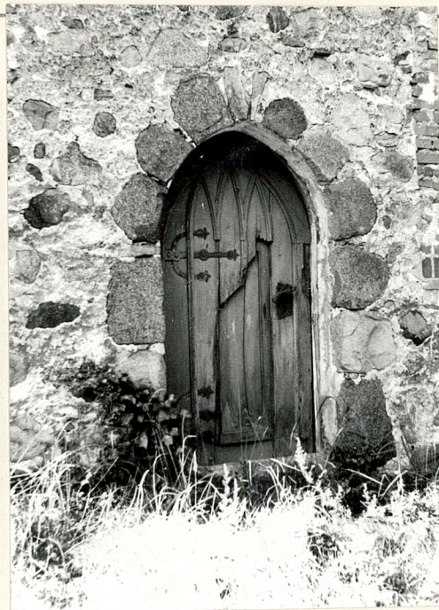
portal i drzwi w elewacji północnej