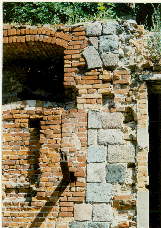
Pozostałości pierwotnego otworu okiennego elewacji połudn.