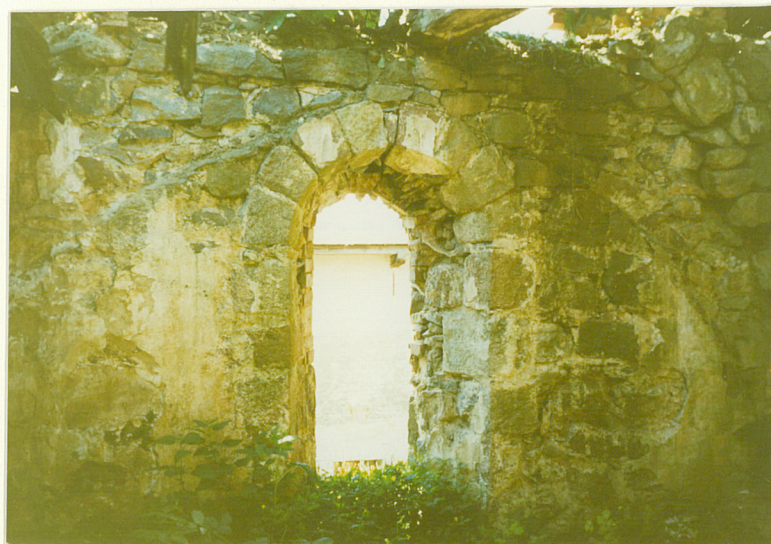
Ślad oporu sklepiennego w górnej partii połudn. ściany prezbiterium