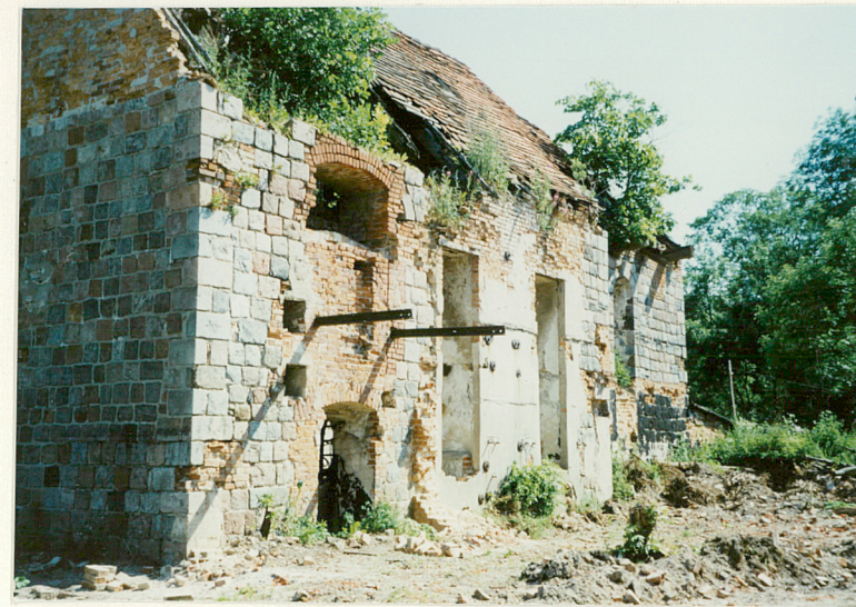
Elewacja połudn. od pd.-zach.