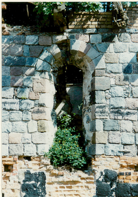
Otwór okienny połudn. elewacji prezbiterium