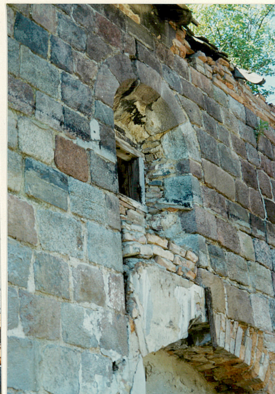
Pozostałości pierwotnego otworu okiennego elewacji półn.