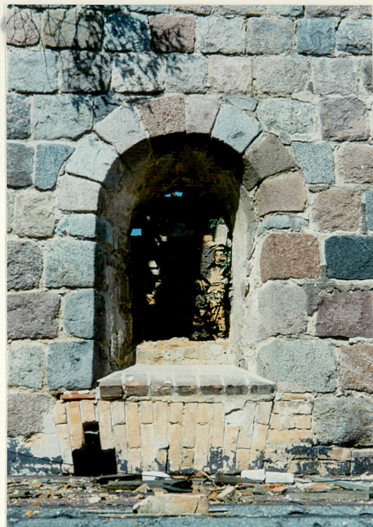
Otwór okienny elewacji wsch.