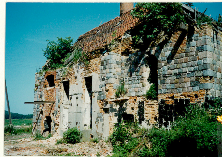
Elewacja połudn. od pd.-wsch.