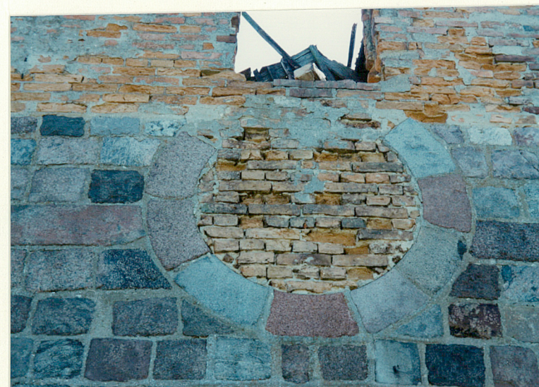
Zamurowany okulus w elewacji zach.