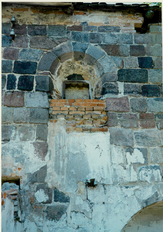
Pozostałości środkowego otworu okiennego elewacji półn.