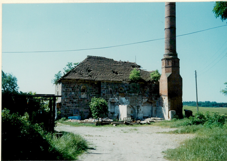
Widok od strony półn.

11. Zdjęcia, rzut, przekrój, sytuacja, orientacja