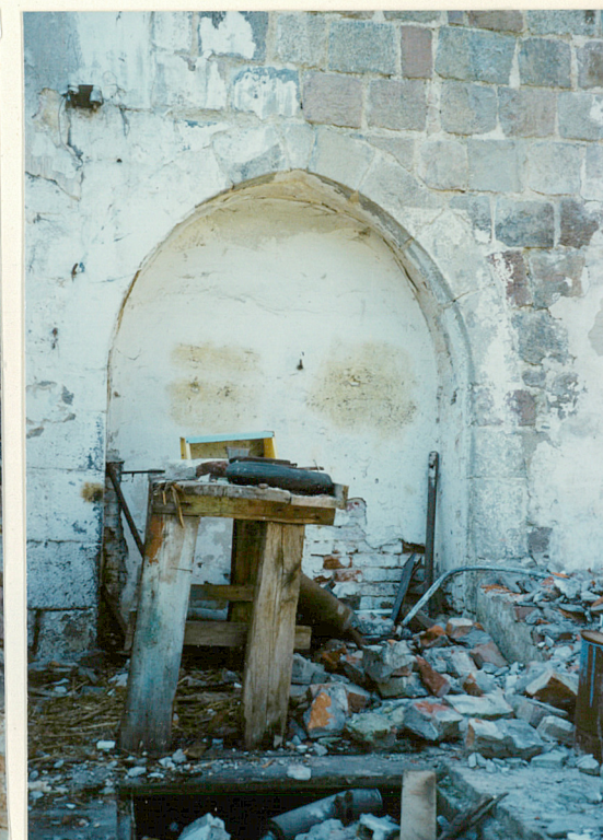
Zamurowany portal elewacji półn.

Wkładkę założył: mgr T. Wolender, 08.1995 (imię, nazwisko, data)