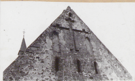
Budowla palowa, pierwotnie bez wieży.