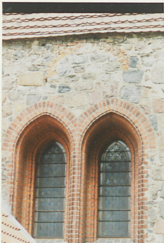
Otwory okienne w połudn. elewacji prezbiterium