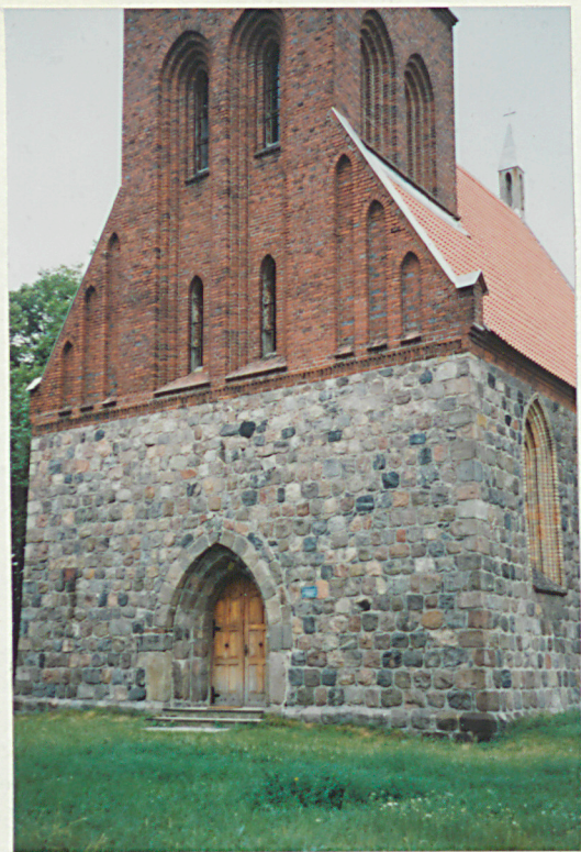
Fragment elewacji zach.