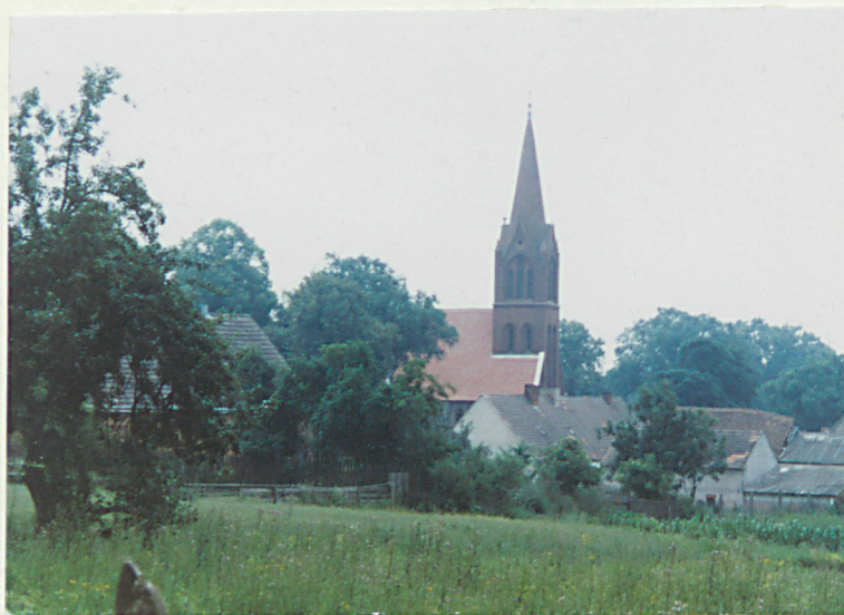
Widok kościoła wraz z otoczeniem