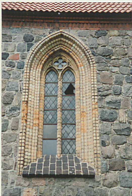
Otwór okienny elewacji półn.