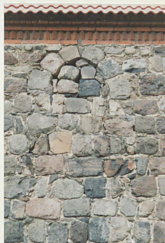
Pozostałości pierwotnego otworu w elewacji pd.prezbiterium