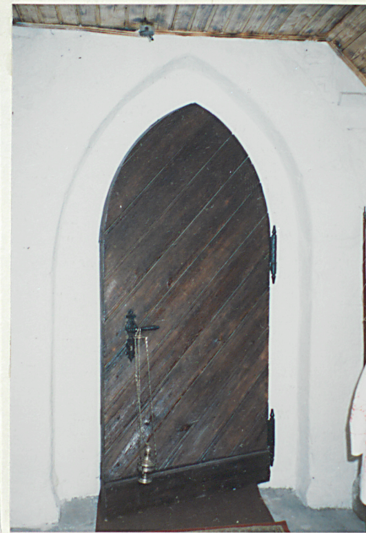
Portal w połudn. ścianie prezbiterium