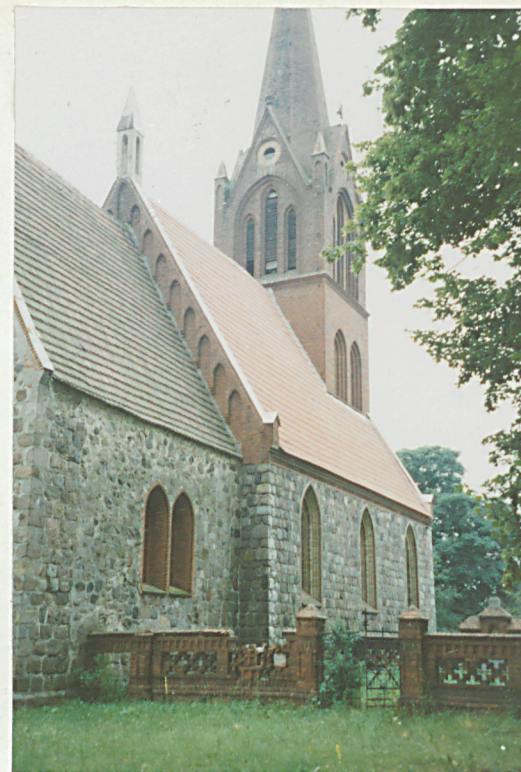
Widok od pn.-wsch.