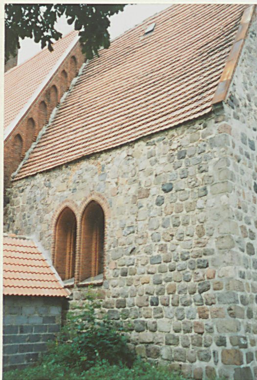
Elewacja połudn. prezbiterium