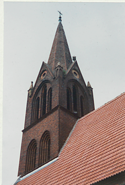
Wieża od połudn.-wsch.