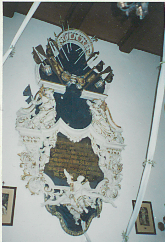
Epitafium na ścianie półn. ławy.