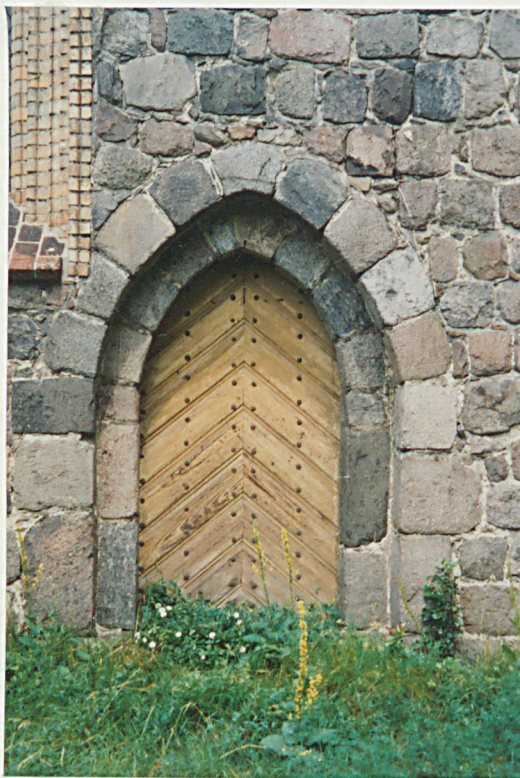
Portal elewacji połudn.