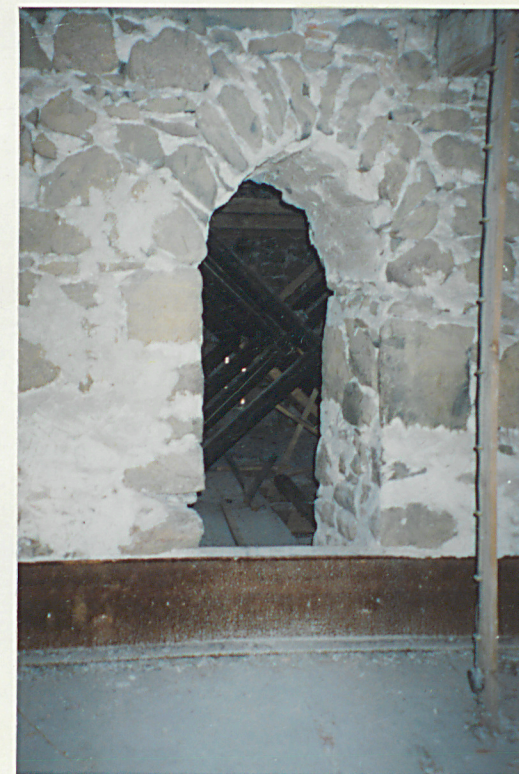
Otwór komunikujący poddasze nawy i prezbiterium