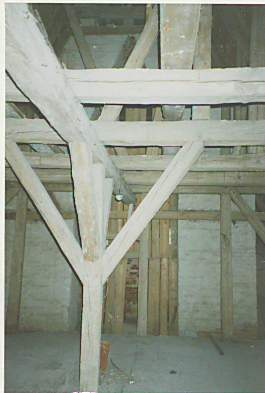
Fragment więźby dachowej