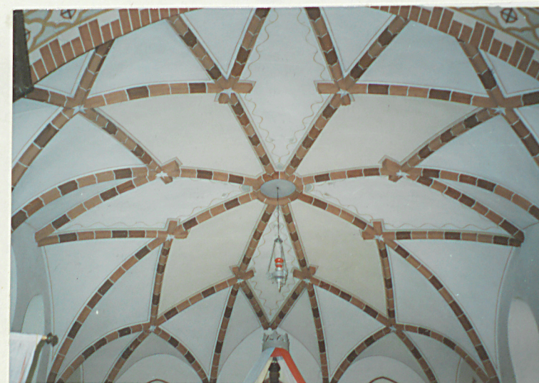
Fragment sklepienia prezbiterium