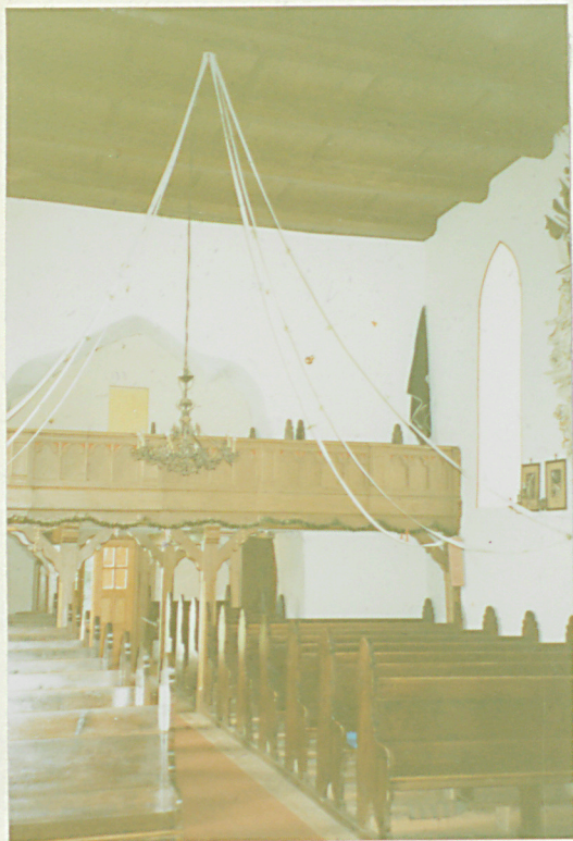
Widok zach. partii wnętrza