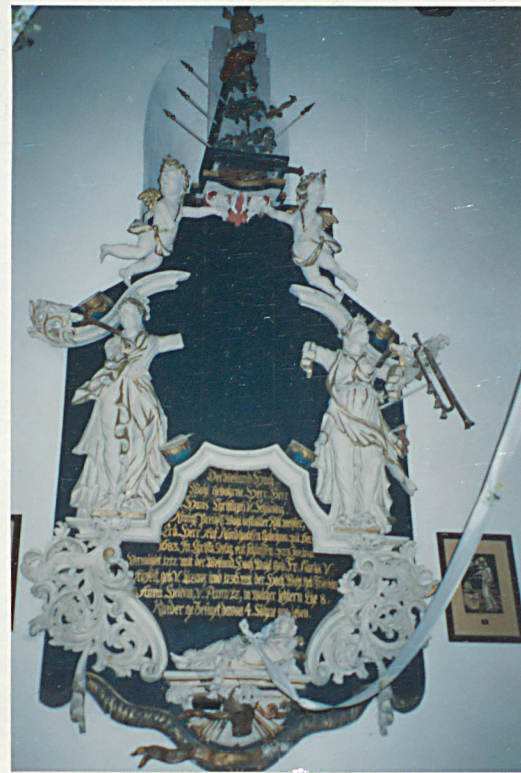
Epitafium na ścianie połudn. nawy