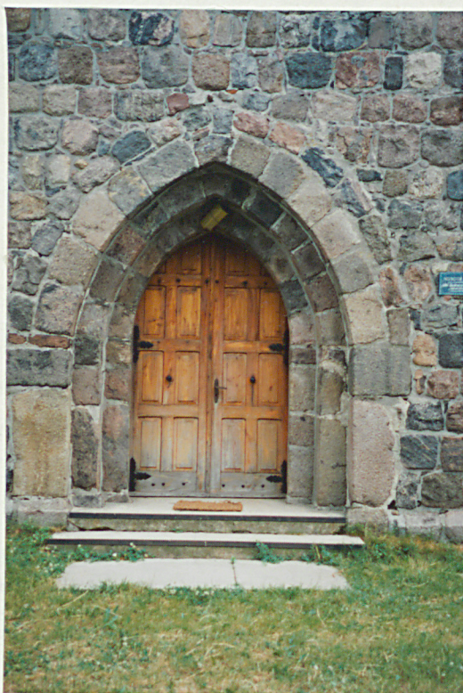
Portal elewacji zach.