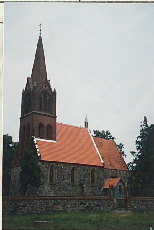
Widok od pd.-zach.