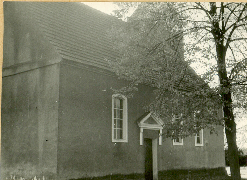
widok od strony północno-wschodniej

11. Zdjęcia, rzut, przekrój, sytuacja, orientacja