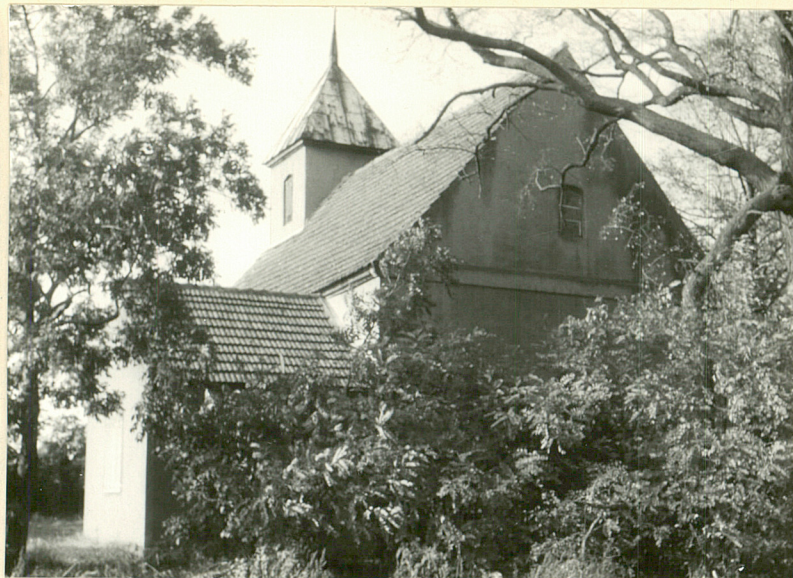
widok od strony południowo-wschodniej