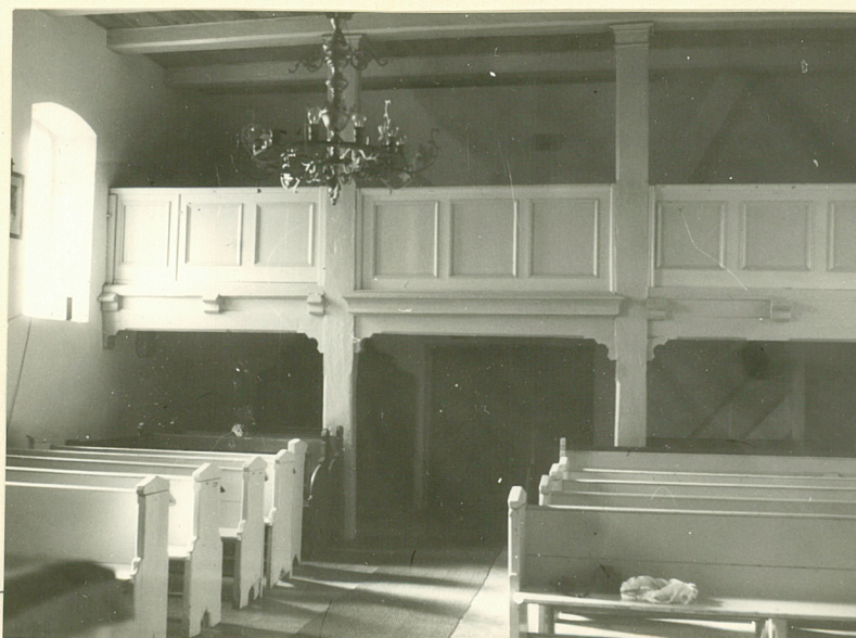
wnętrze -widok od strony wschodniej w kierunku zachodnim

Wkładkę założył: Ewa Soroka, 1990.10.10.