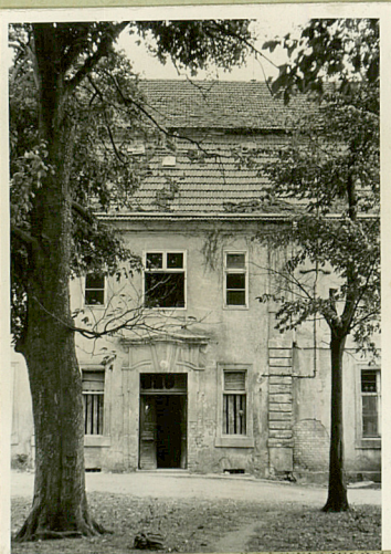
Zjednoczenie - zam. 1858, 18. 11. 57 - 12000 - kart.