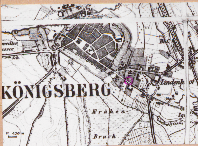
Mapka miasta z 1892r. /orientacja/