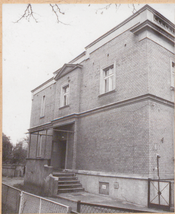
1. Elewacja frontowa - płd.-zach. 2. Elewacja boczna - płn.-zach.