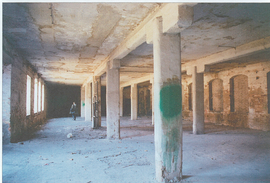
Wnętrze hali - parter