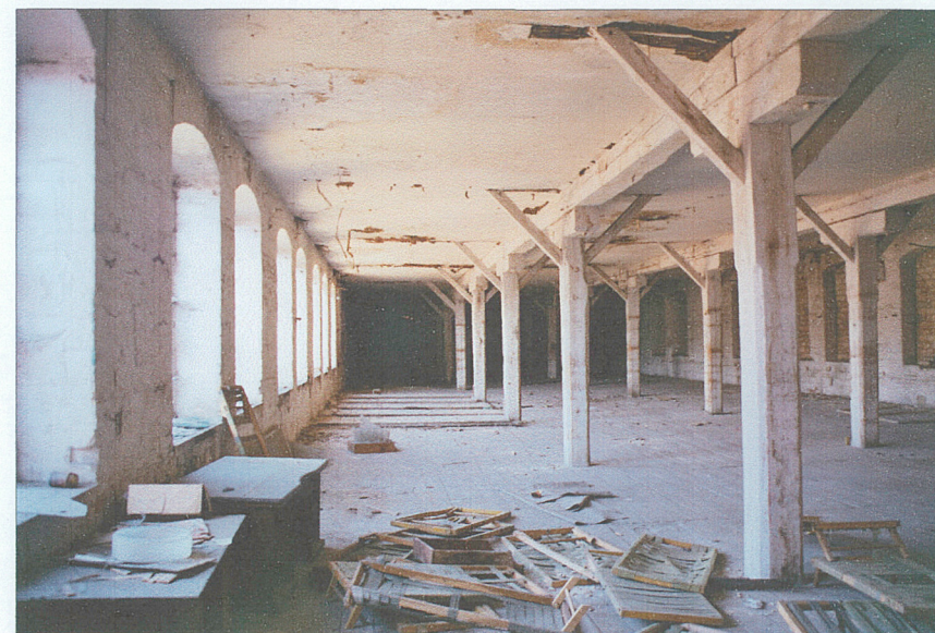
Wnętrze hali - piętro