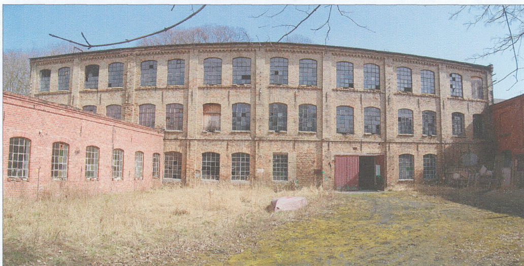
Widok z dziedzińca na elewację frontową

W roku 2000 (po prywatyzacji z 1999 roku) obiekty byłej fabryki Neusteina przy zaułku ul. Jeziornej zostały przejęte przez gminę Barlinek i do tej pory stanowią jej własność. Aktualnie budynek jest niezabezpieczony i skrupulatnie dewastowany przez młodzież i ludzi bezdomnych.