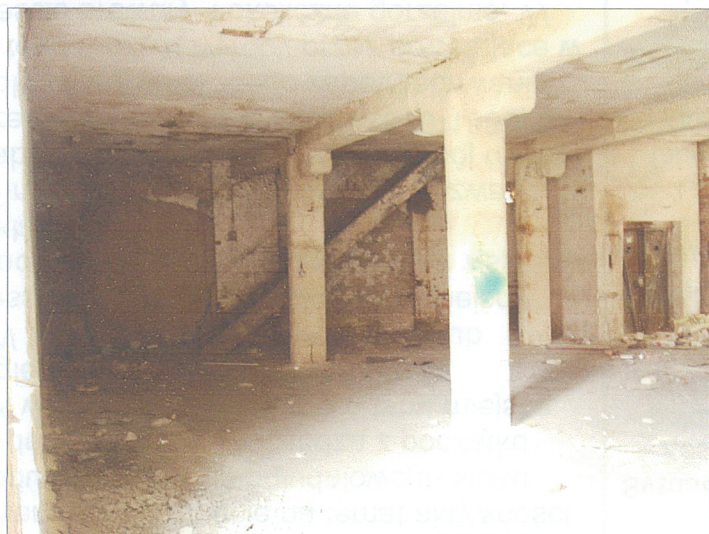
Wnętrze hali - widok w parterze na schody