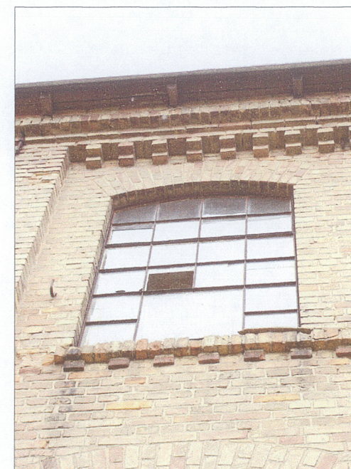
Ceglany detal elewacji frontowej