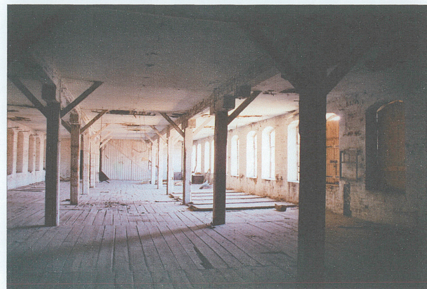
Wnętrze hali - piętro