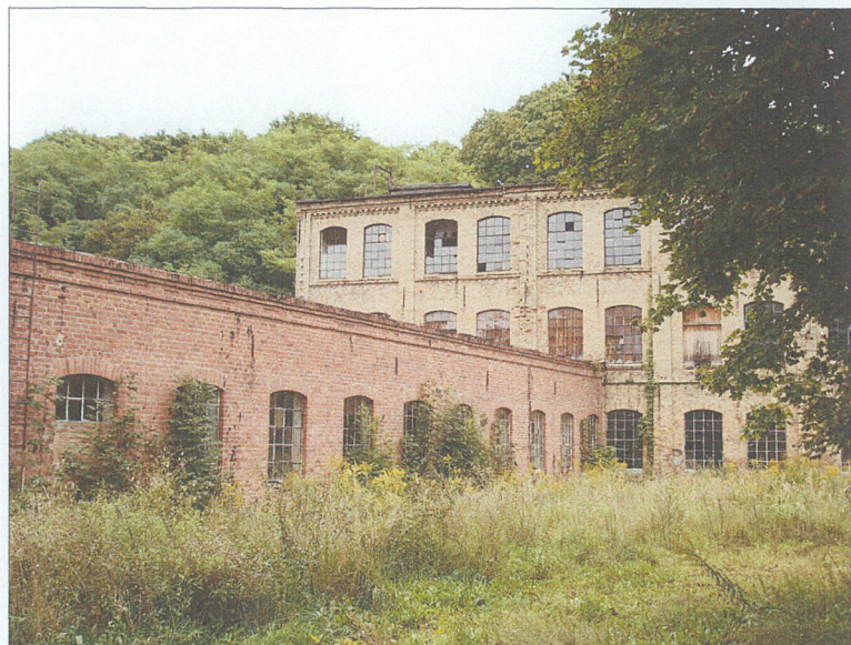
Widok na połączenie hali magazynowej i stolarnii