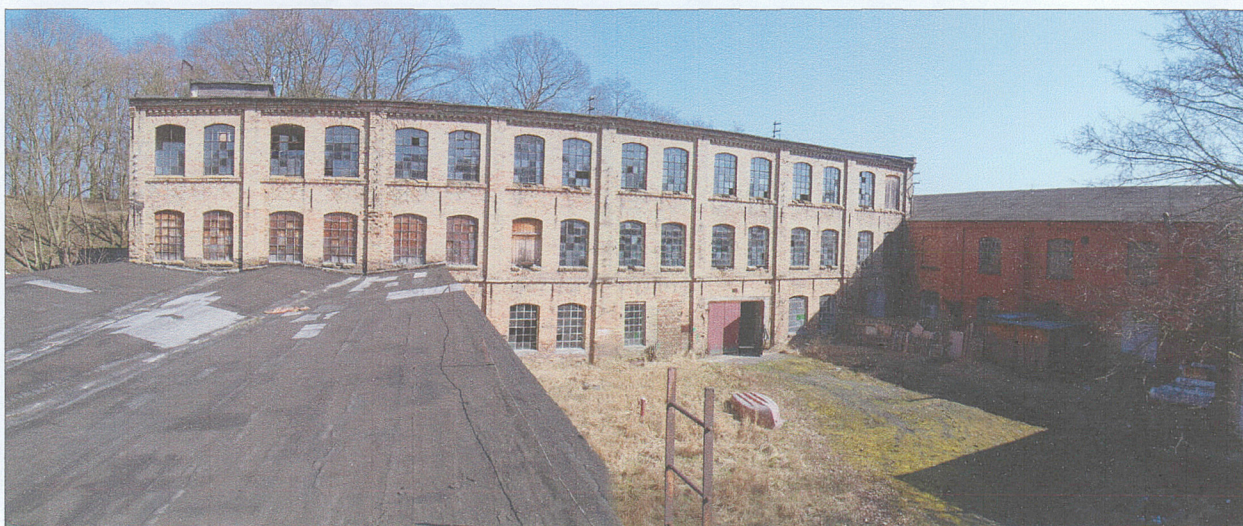
Widok na dziedziniec