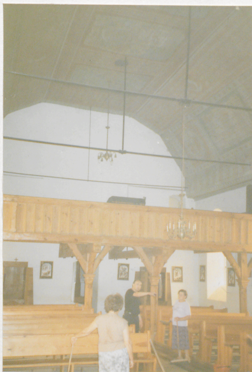
Widok zach. partii wnętrza