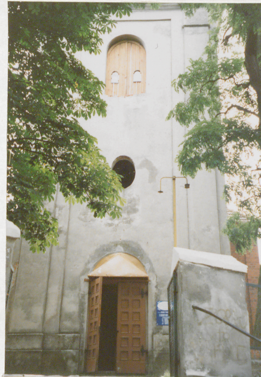
Fragment elewacji zach.