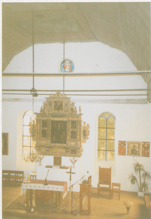
Widok wsch. partii wnętrza