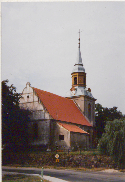
Widok od pn.-wsch.

11. Zdjęcia, rzut, przekrój, sytuacja, orientacja