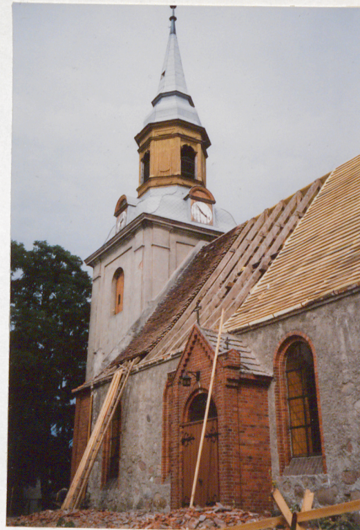
Widok od połudn.-wsch.