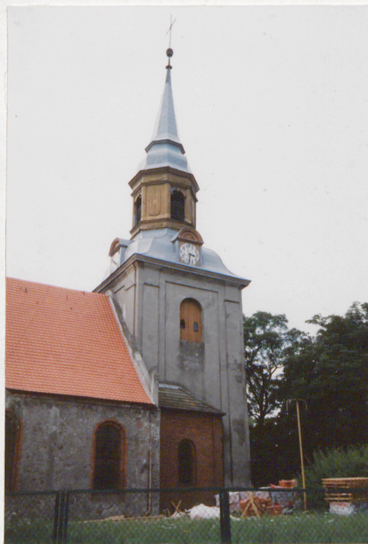
Fragment elewacji półn.