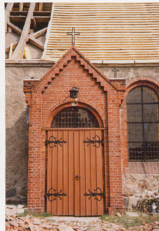
Portal elewacji połudn.