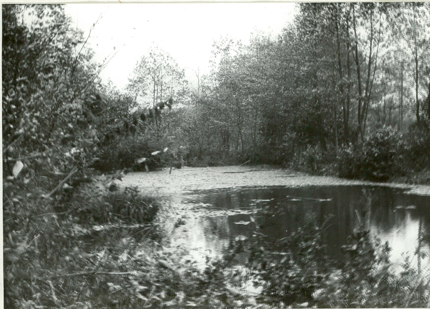
POT. 2 - DOBROWO Zeniedbery staw