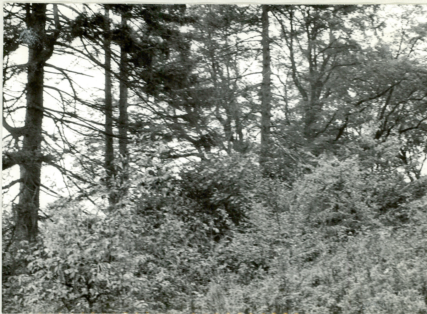
FOT. 4 - DOBROWO Parkowy drzewostan