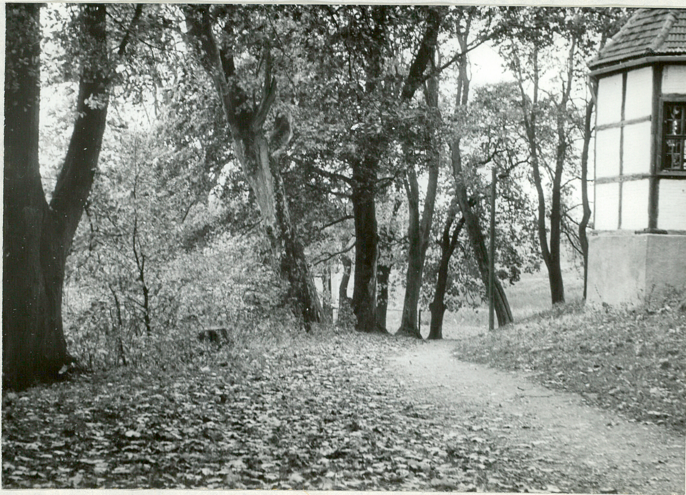
FOT. 3 - DOBROWO

Kasztanowa aleja łożo zabytkowego kościółka