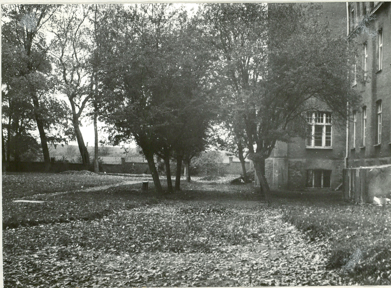
FOT. 5 - DOBROWO

Pozostałość po alei z głogu, w głębi widoczne ogrodzenie z cegły i kamienia