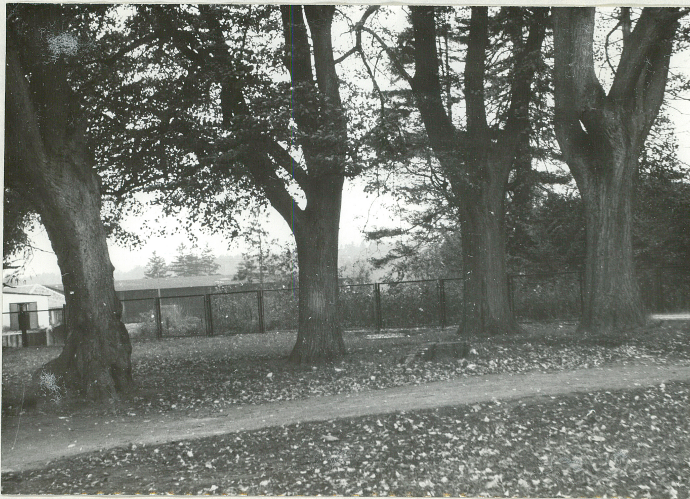
FOT. 6 - DOBROWO

Rząd lip, na dalszym planie ogrodzenie z siatki metalowej oraz fragment zabudowy czworakowej