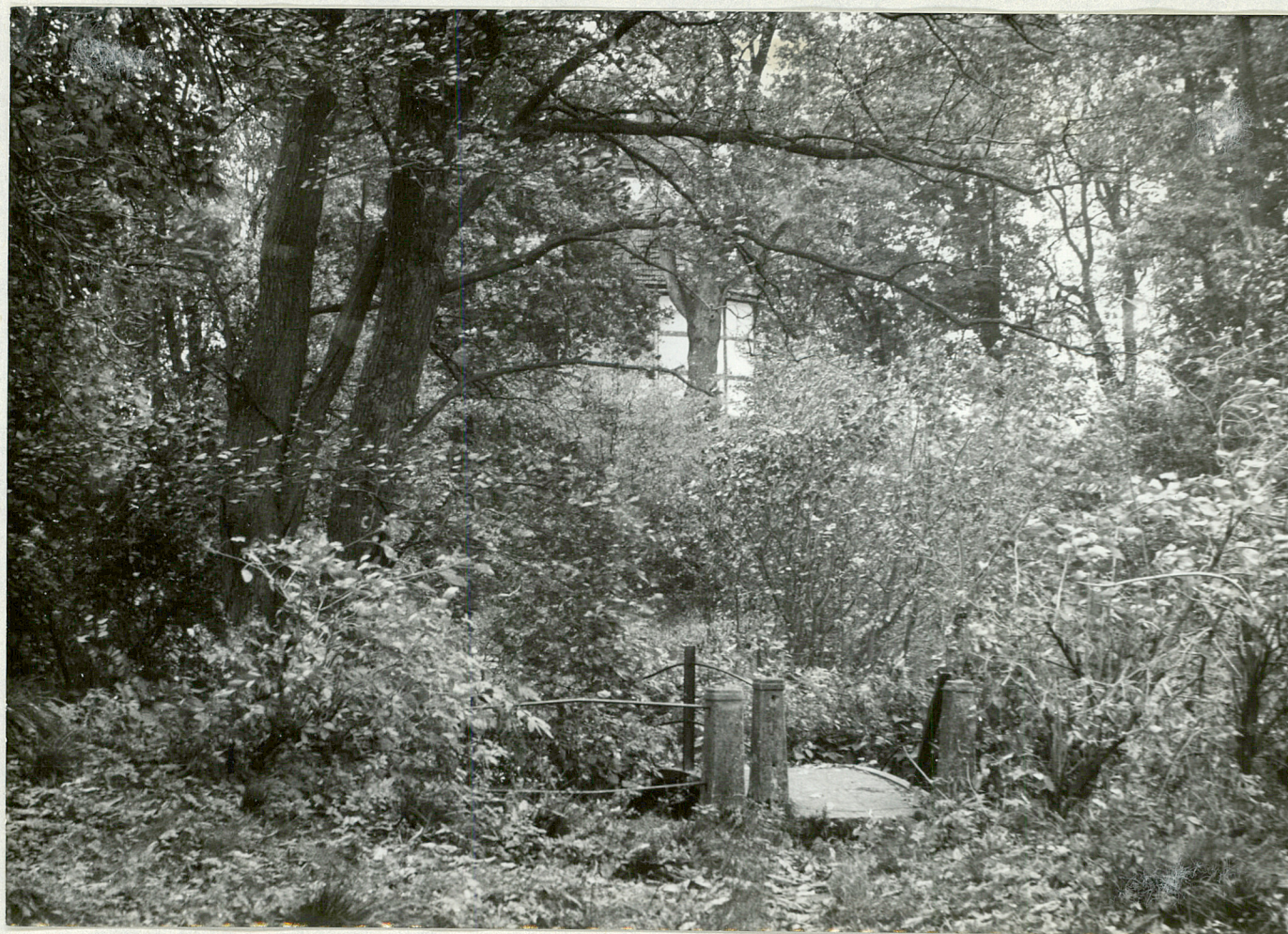
FOT. 1 - DOBROWO

Betonowy mostek, w głębi fragmenty drzewostanu