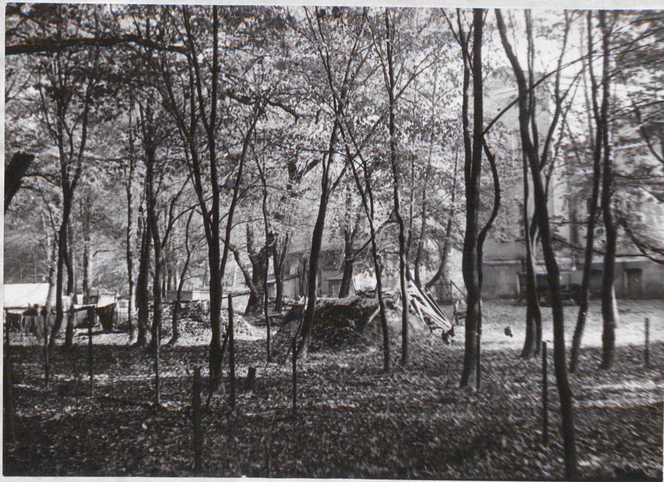
FOT. 1 - POPIELEWKO - Park

Zza gęstego samosiewu ledwie widoczna część pałacu