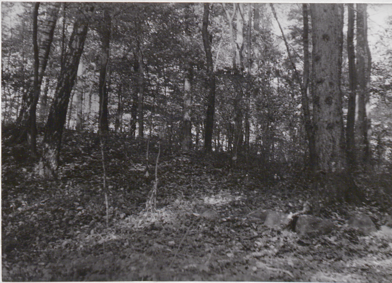
FOT. 4 - POPIELEWKO - Park Porószy bluszczem kurhanik