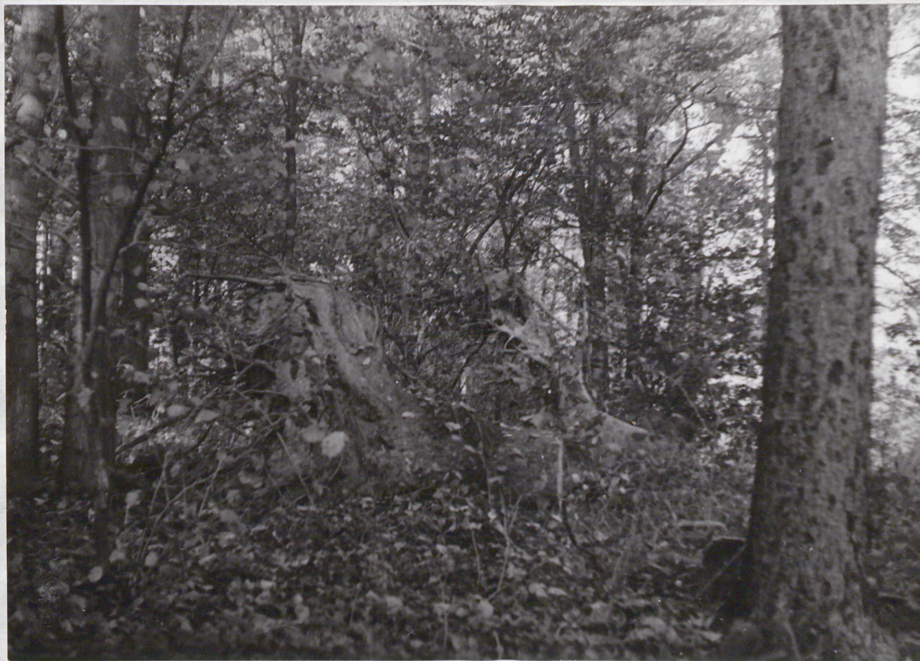
FOT. 5 - POPIELEWKO - Park