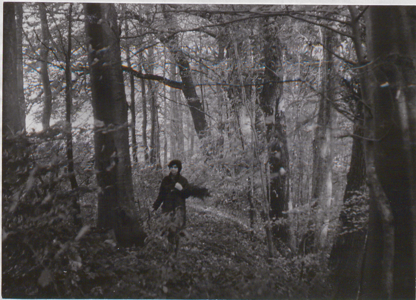
FOT. 5 - POPIELEWKO - Park

Północno-zachodni skraj parku Gęsto porośnięty bukami i dębami