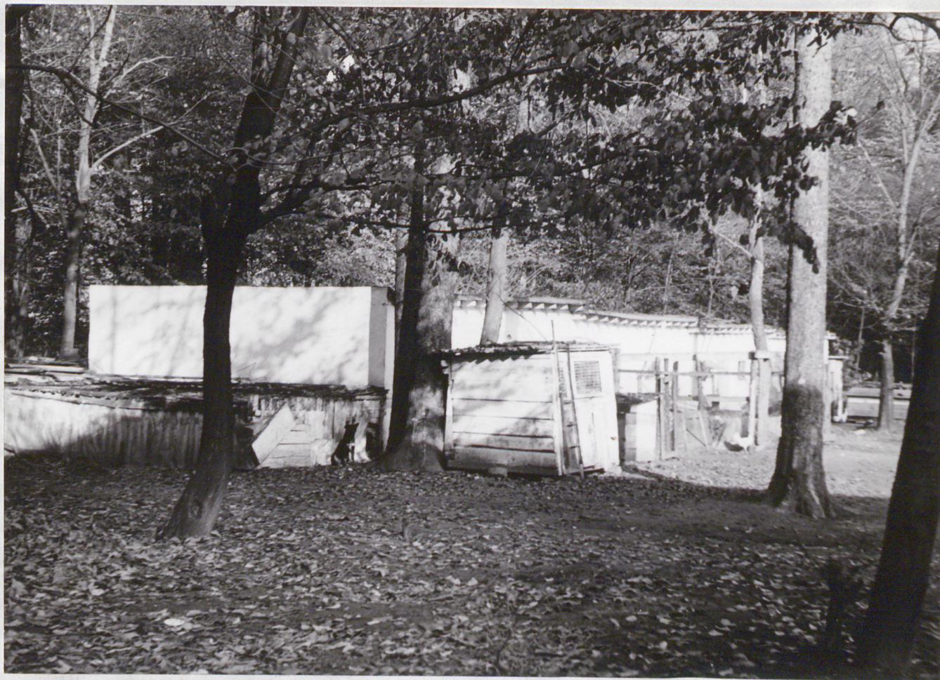
FOT. 2 - POPIELEWKO - Park

Kurniki i ohlewiki znajdujące się na obszarze parku