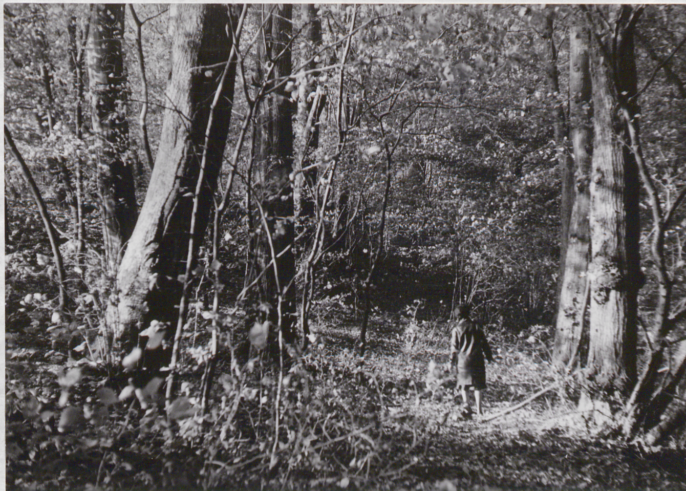
FOT. 3 - POPIELEWKO - Park Fragment alei lipowej