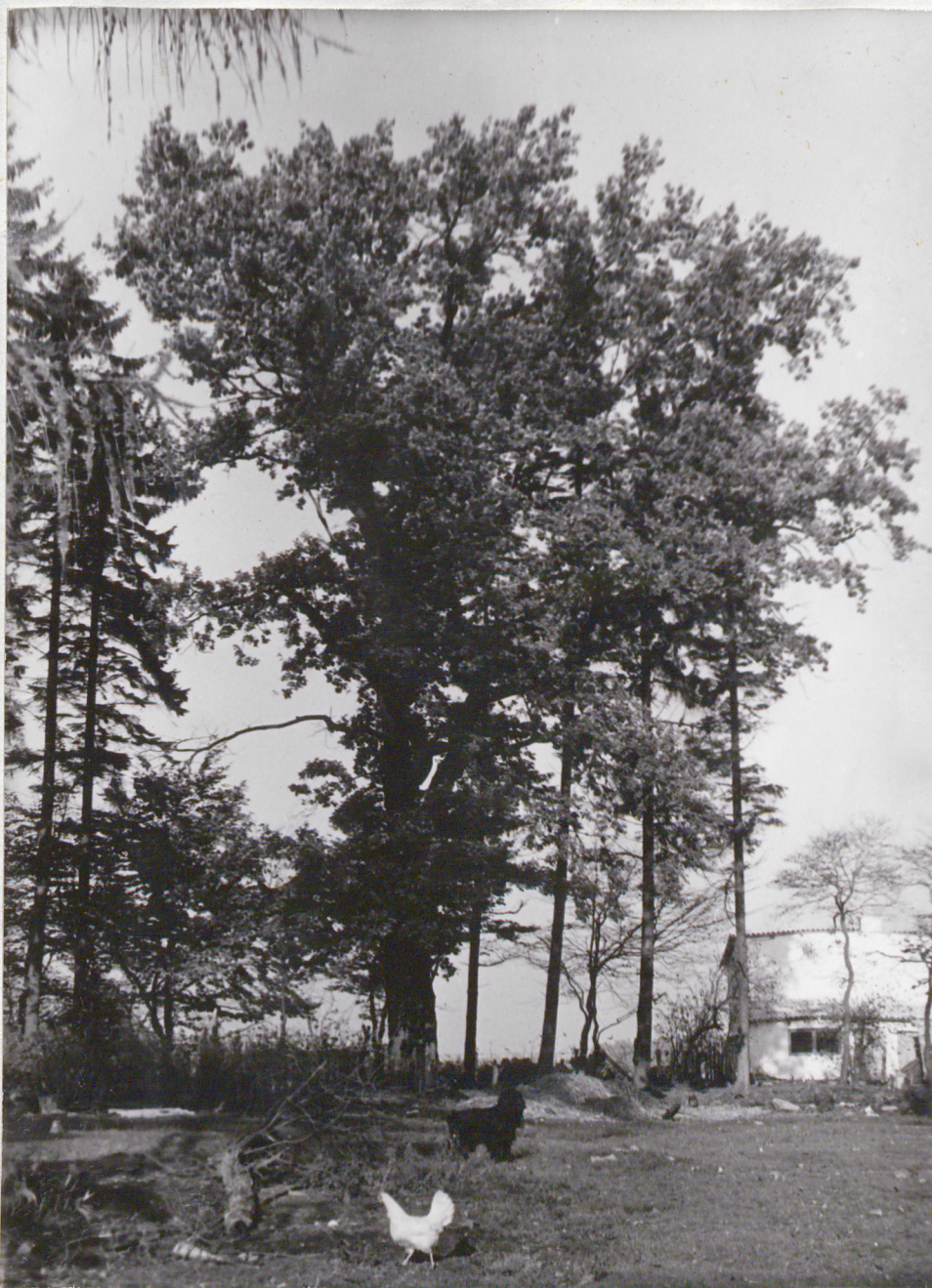
FOT. 2 - WARDYN DOLNY - Park

Dąb szypułkowy dziwnym zbiegiem okoliczności nie trafił pod topór