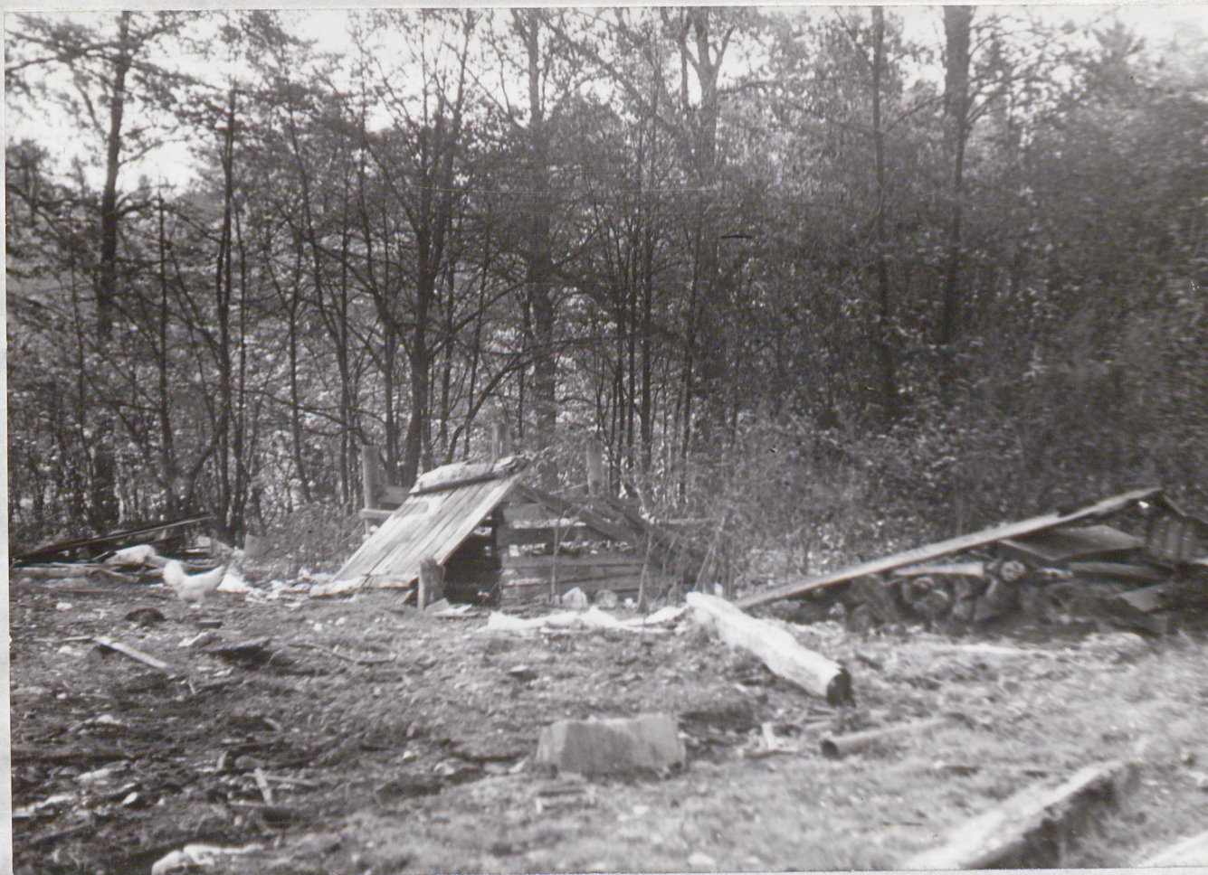
FOT. 3 - WARDYN DOLNY - Park "Porządki" na tle grupy klonów, w większości samosiewów