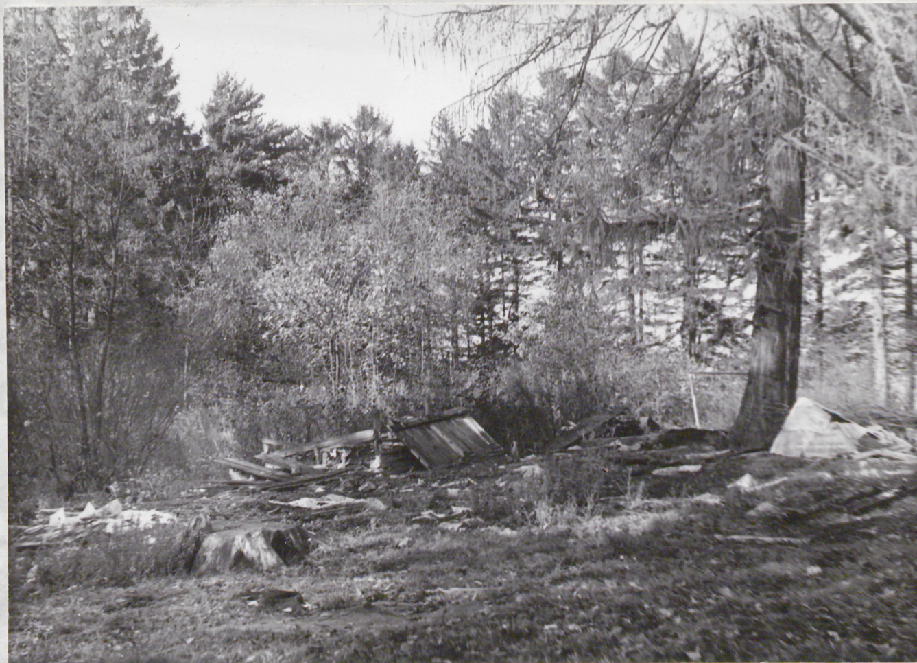
FOT. 1 - WARDYN DOLNY - Park

Bałagán, pnle ściętych drzew - do wizytówka parku