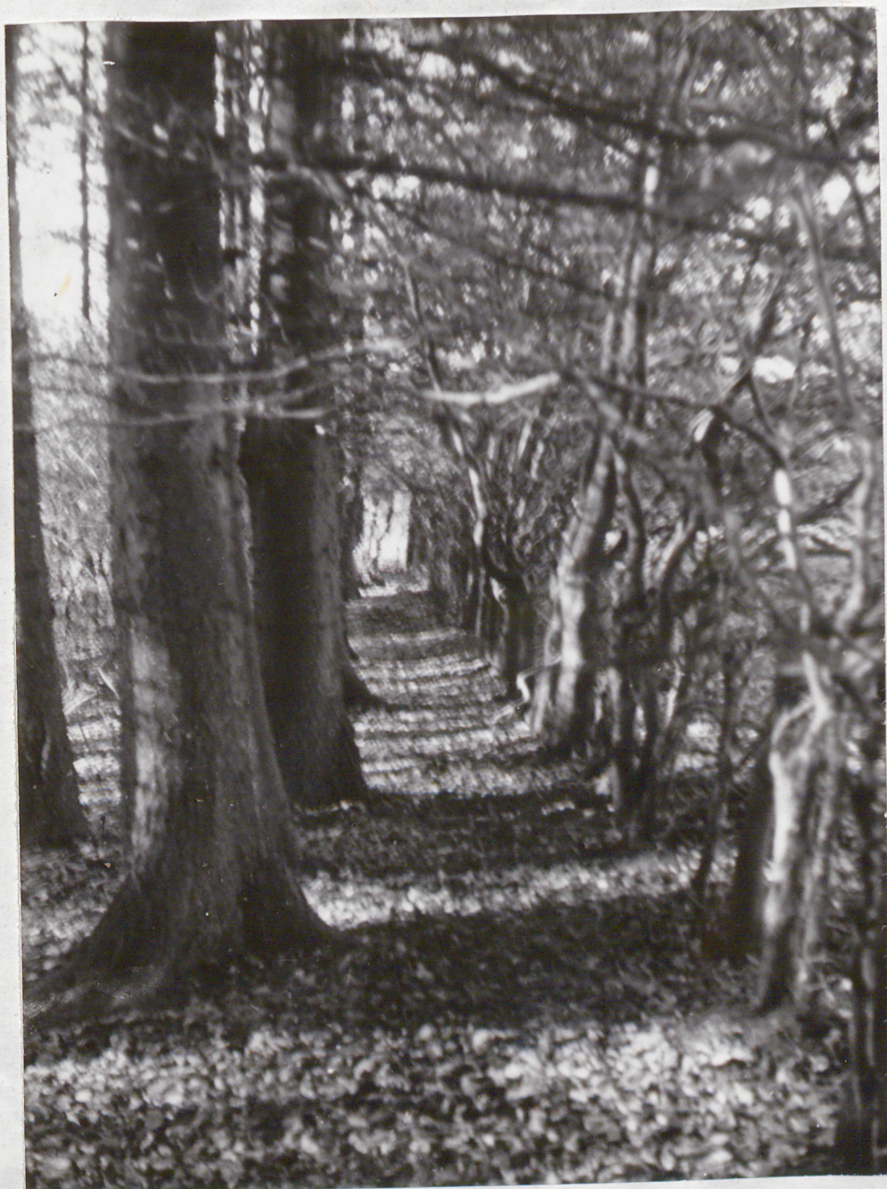
FOT. 4 - WARDYN DOLNY - Park

Ocalały fragment alei spacerowej i szpaleru grabowego