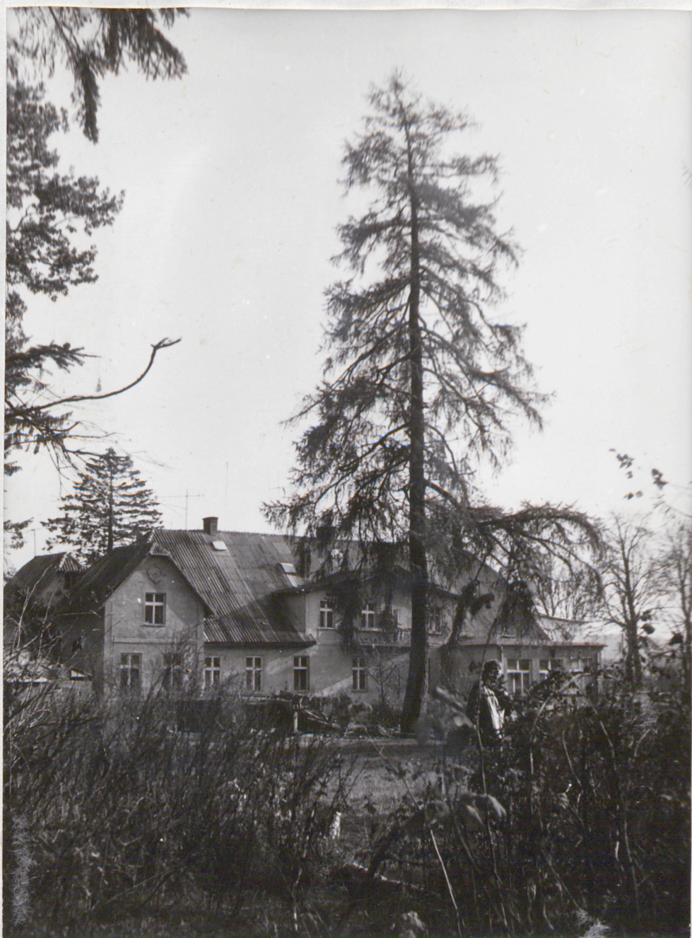
FOT. 5 - WARDYN DOLNY - Park

Ocalały modrzew na tle północno-zachodniej ściany dworu