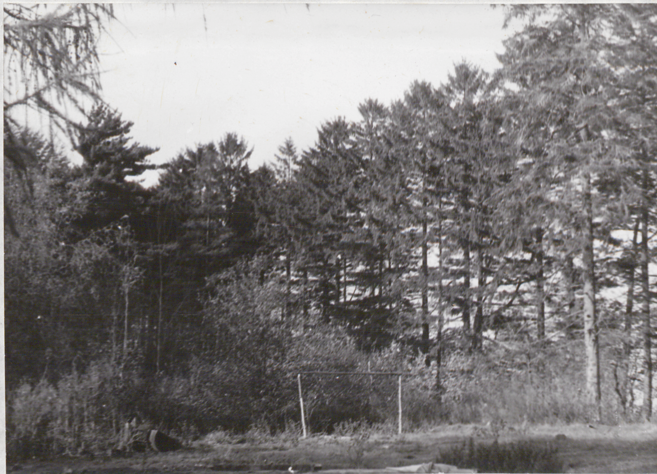
FOT. 6 - WARDYN DOLNY - Park Grupa drzew iglastych