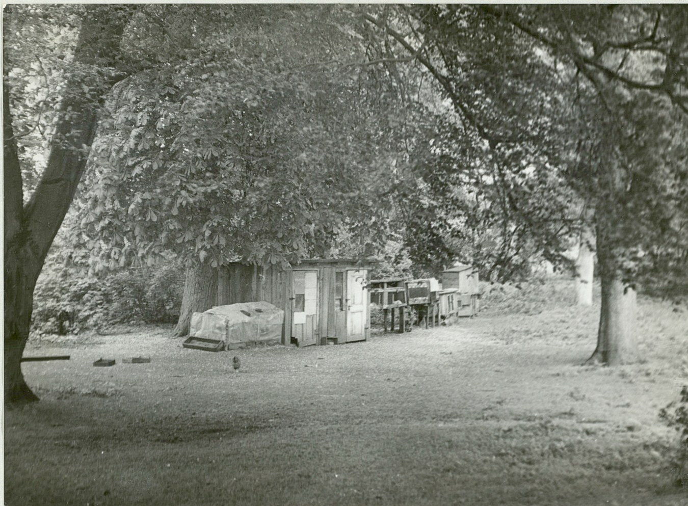
FOE. 2 - KOŁACZ - Park