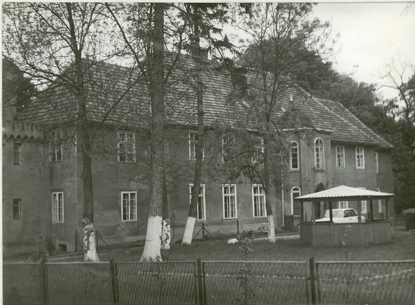
POB. 1 - KOLACE - Park Palace