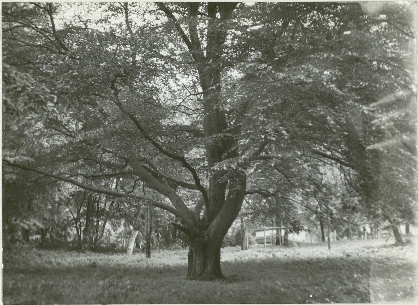
FOT. 5 - KOLACZ - Park Buk szaregony