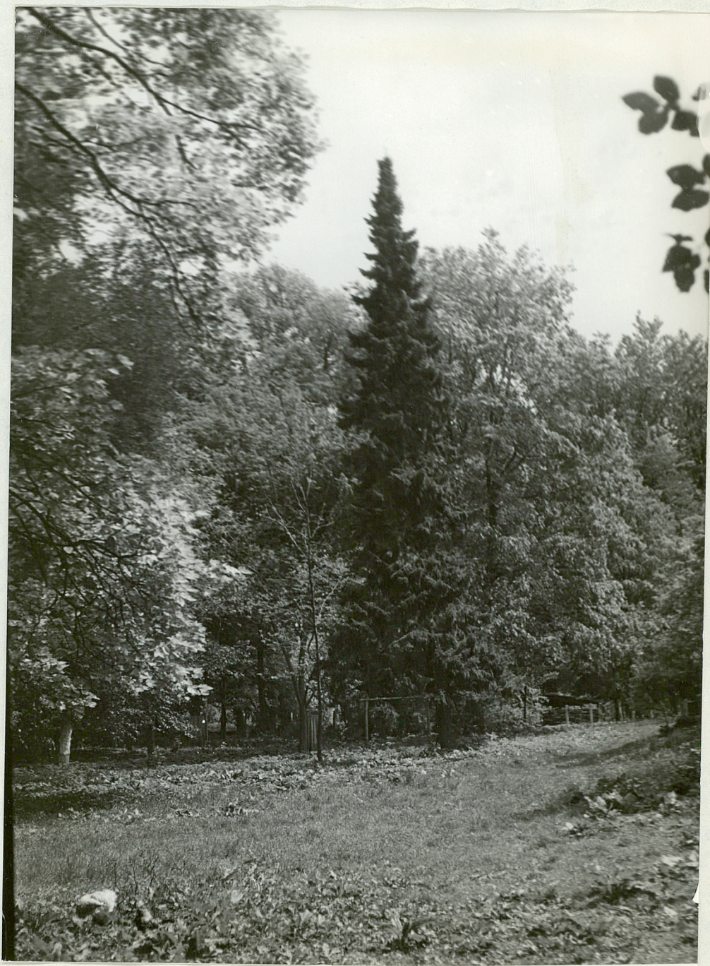
FOT. 4 - KOLACE - Park Światła serbski