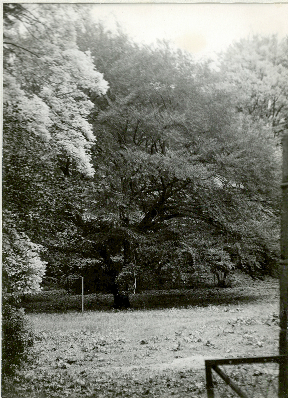
FOR. 3 - KOLACZ - Park Olas Duke ozernonolistnego