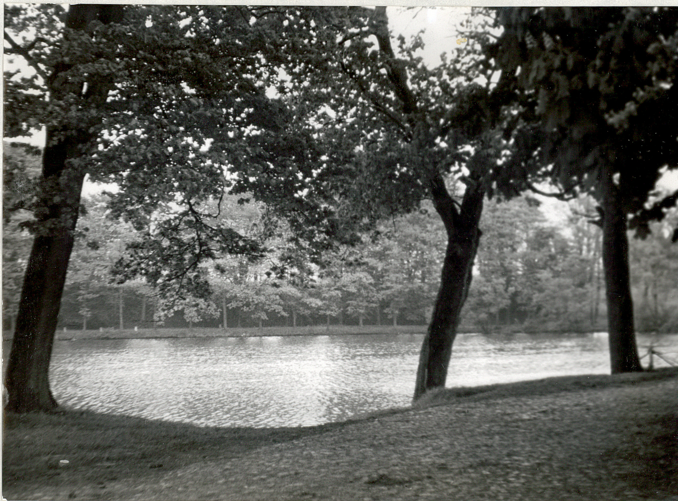
FOT. 1 - TYCZEWO - Park Widok na jezioro