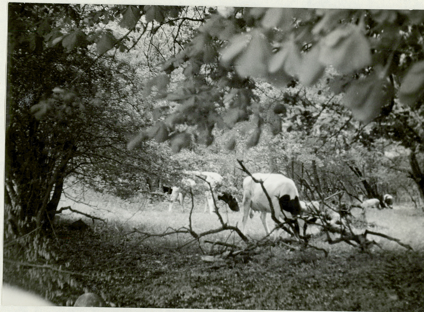
FOT. 6 - TIGZENO - Park Wypas bydła w parku