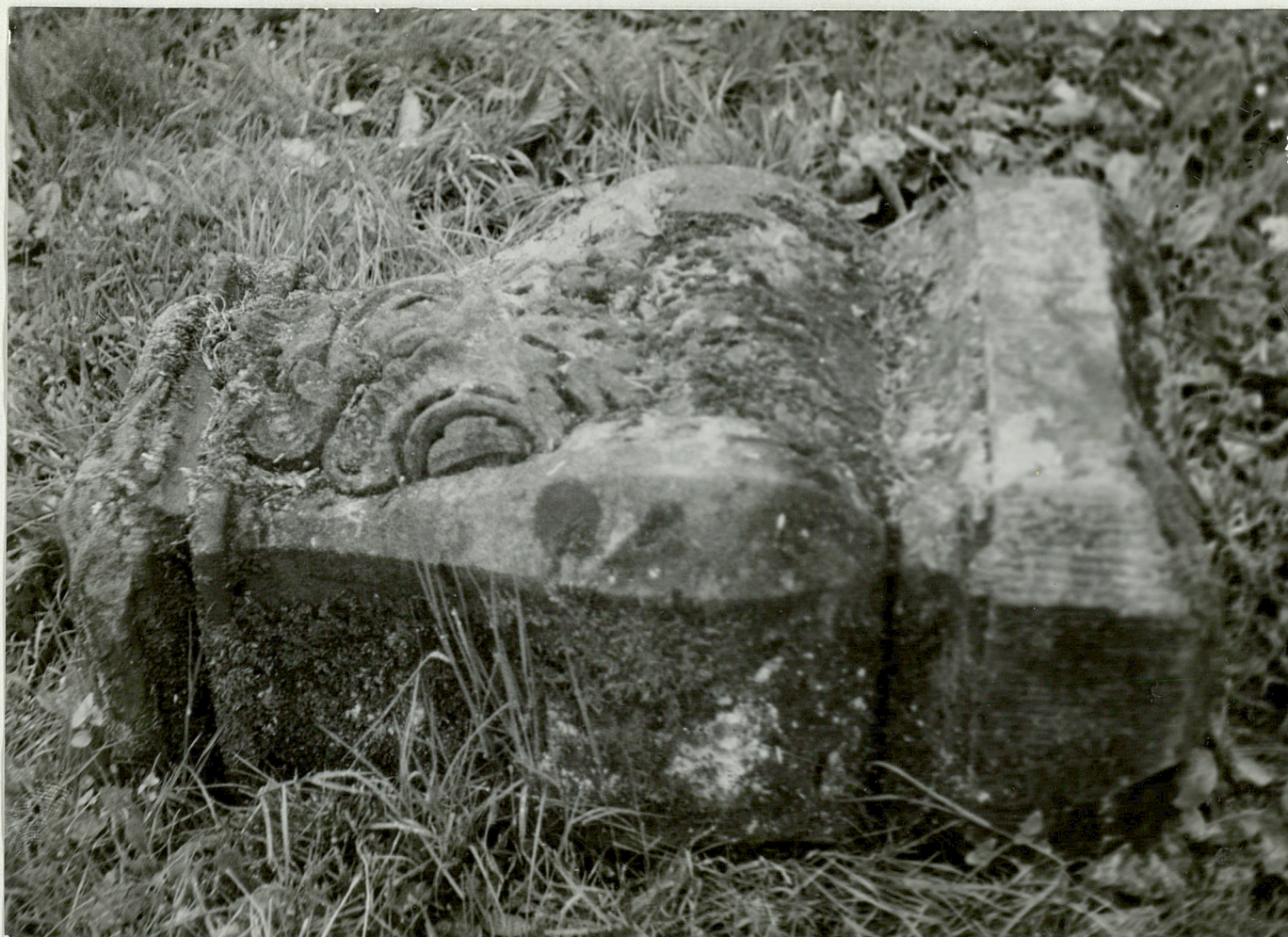
FOR. 4 - TICHEWO - Park Fragment rzeźby z piaskowca