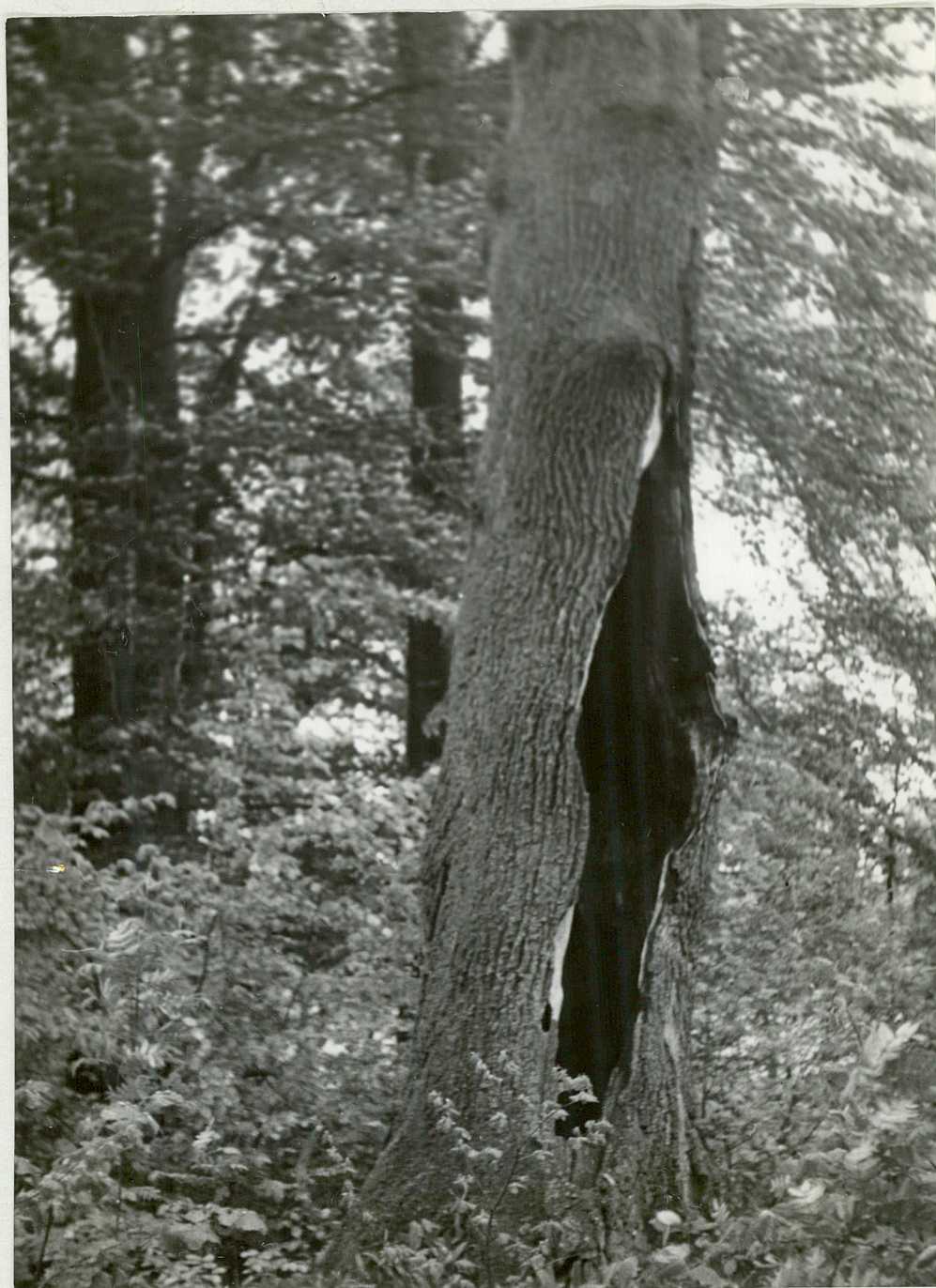
FIG. 5 — ТИЦЗНО — Порк выпалony пeн дѣбу