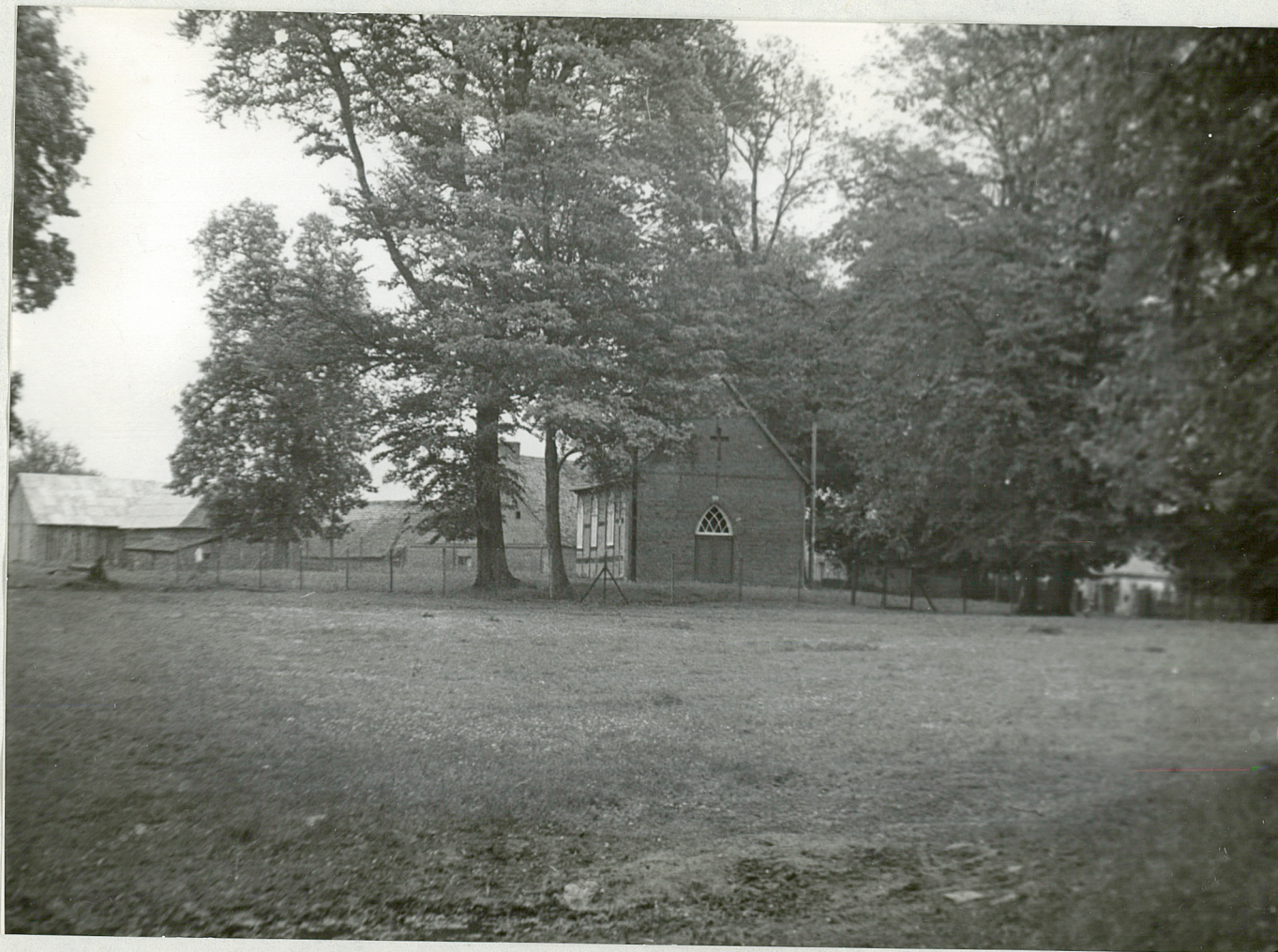
FIG. 2 - TIGERHO - Park Koplica przy parku