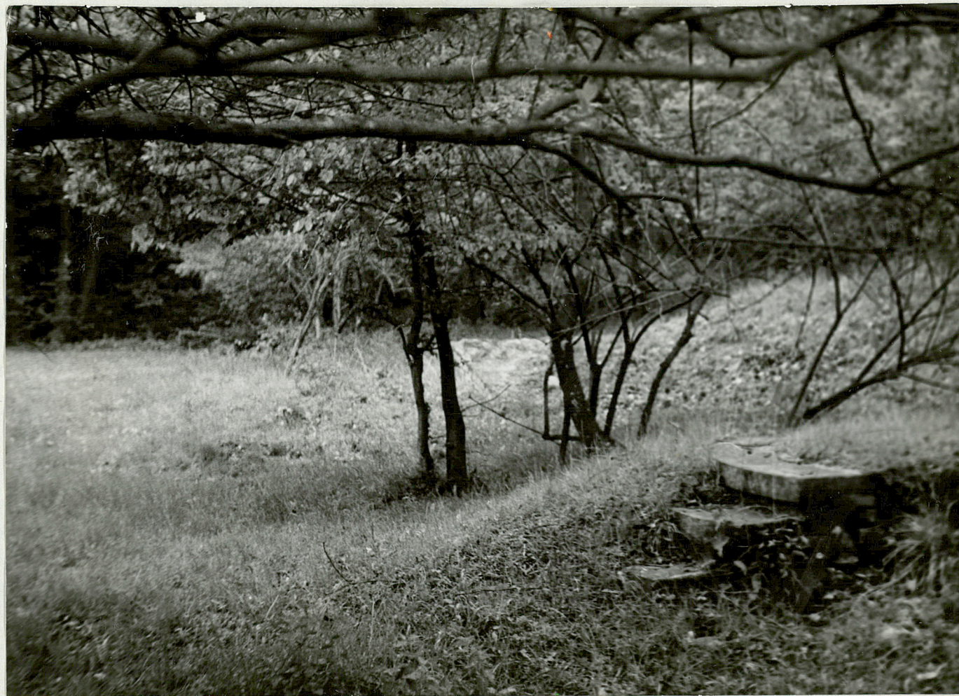
FOT. 3 - TICHEWO - Park

Tyle pozostało ze świetnego ongiś pałacu