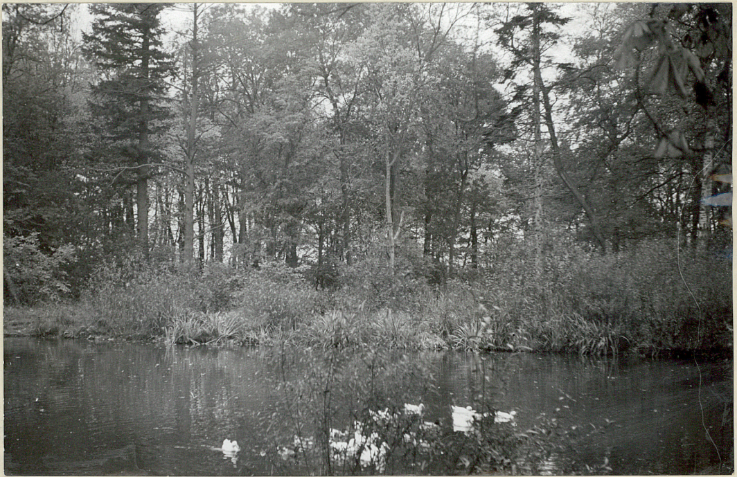
HR 4. PALCEWICE - Park Staw i park