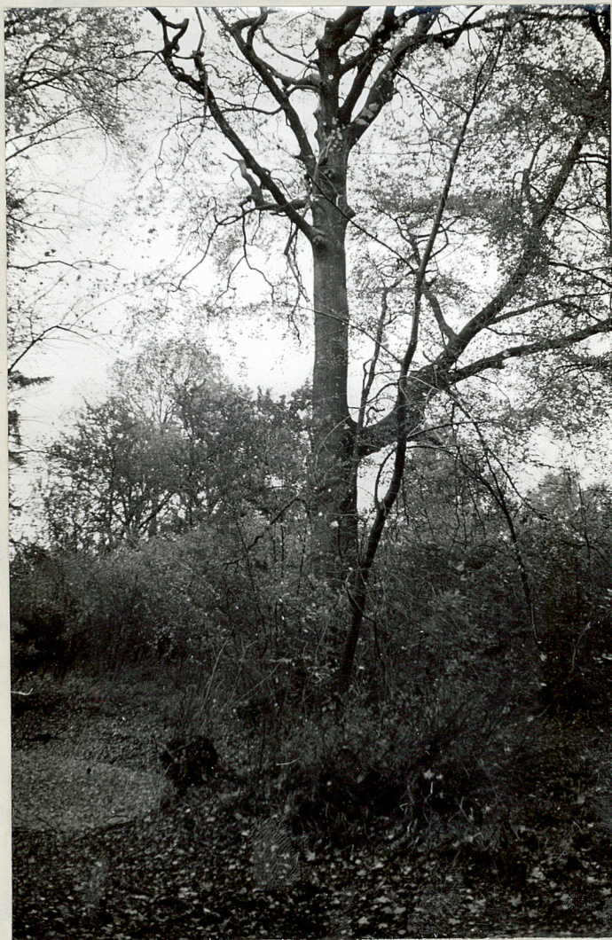
NR 3. PALCZEWICE - Park

Zarośnięty staw w parku, w głębi potężny dąb / Quercus /