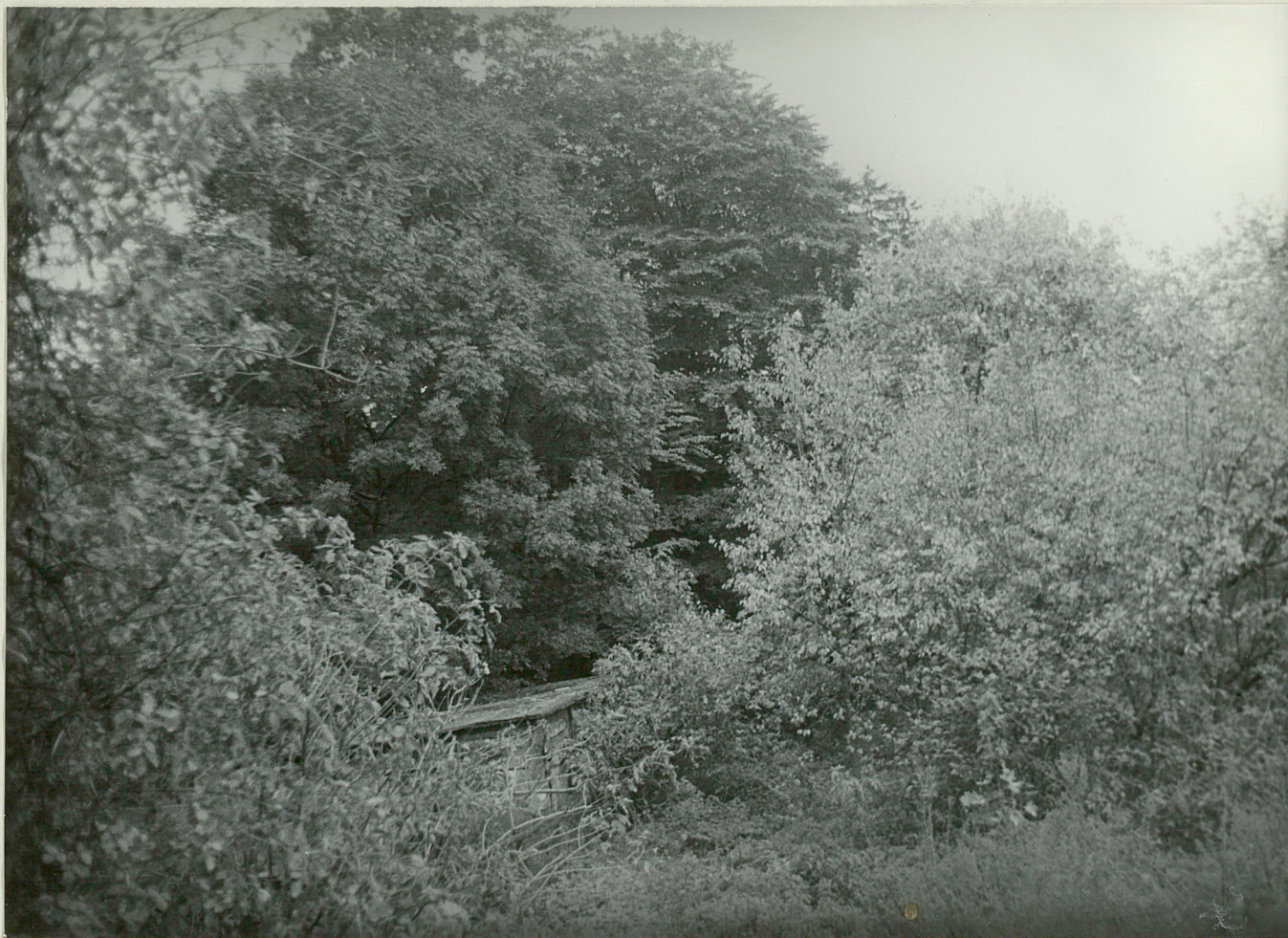
FOT NR 2 - NOWA ŁĘKNICA - park