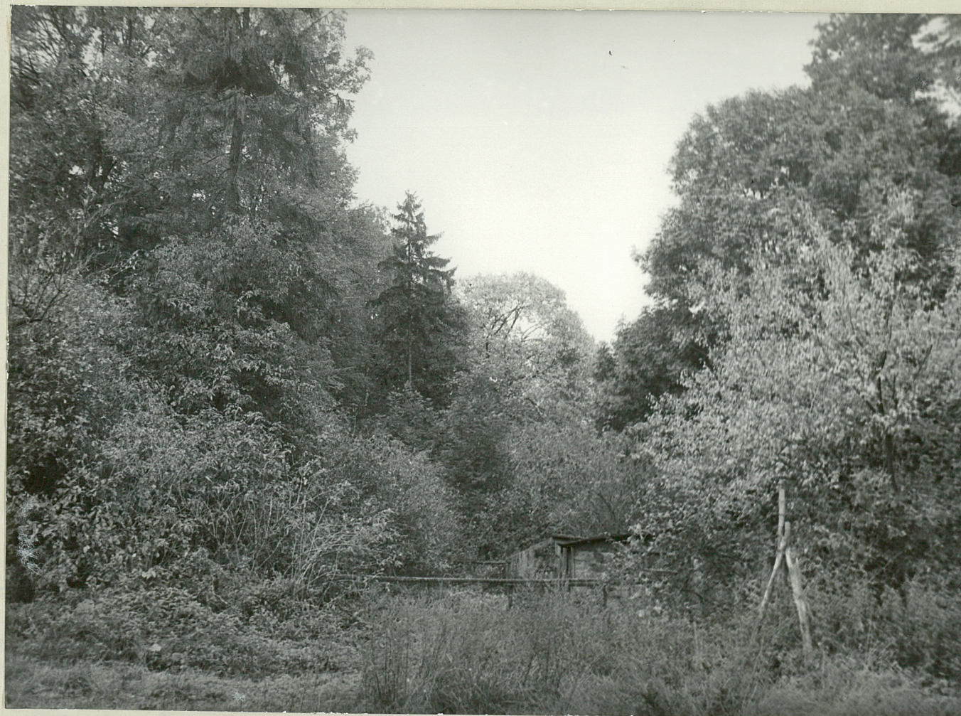
FOT NR 5 - NOWA ŁĘKNICA - park Prowizoryczny kurnik