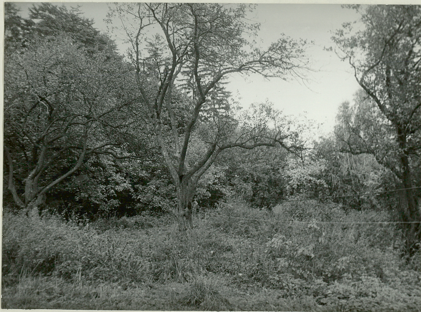
FOT NR 4 - NOWA ŁĘKNICA - park Stary sad