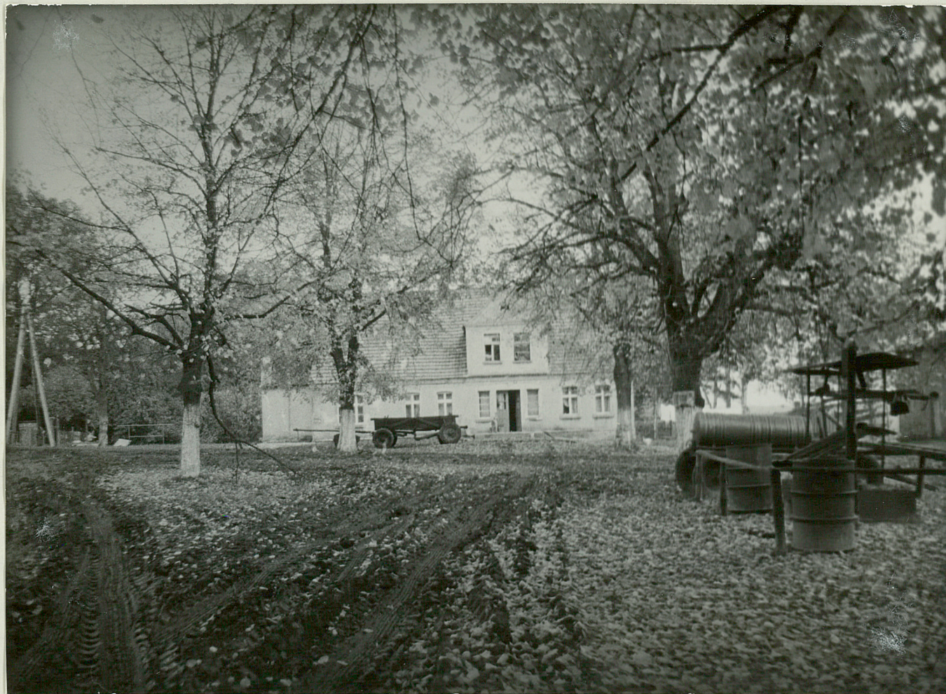
FOT NR 1 - NOWA HĘKNICA - park Widok dworku