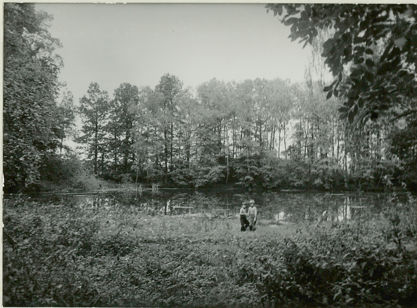
FOT NR 3 - NOWA ŁĘKNICA - park Staw parkowy