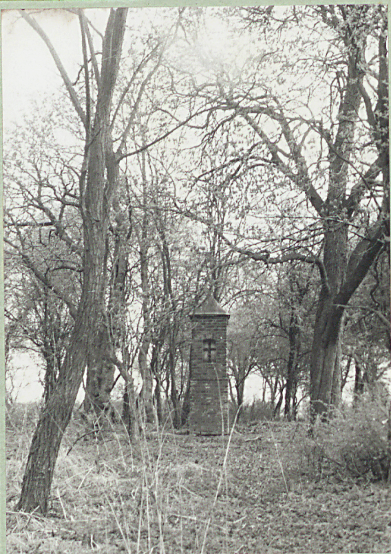
Tuczno, ul. Zamkowa; cmentarz nieczynny 1. Widok ogólny 2. Kapliczka cmentarna 3. Wnętrze: kapliczka i drzewostan