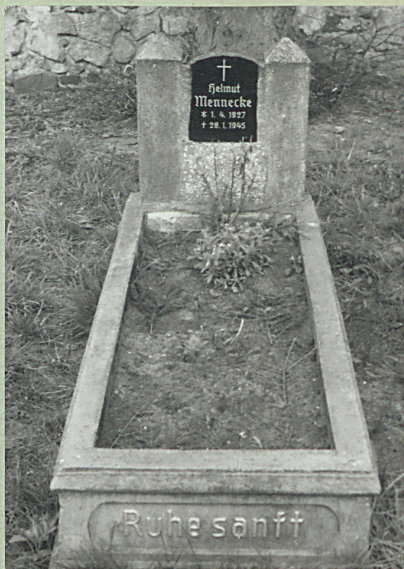
Miłogoszcz, gm. Tuczo; cmentarz przykościelny 1. Widok ogólny 2. Wnętrze 3. Mogiła z 1945 roku