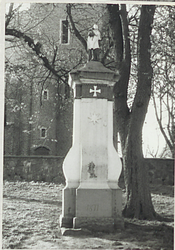
Marcinkówce, gm. Tuczo; cm. przykościelny 1. Widok ogólny 2. Wnętrze - pomnikowe lipy 3. Kościół, mur i brama; obok pomnikowa lipa 4. Kaplica wotywna z 1871 roku