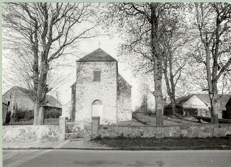
Lubiesz, gm. Tuczo; omentarz przykościelny 1. Widok ogólny