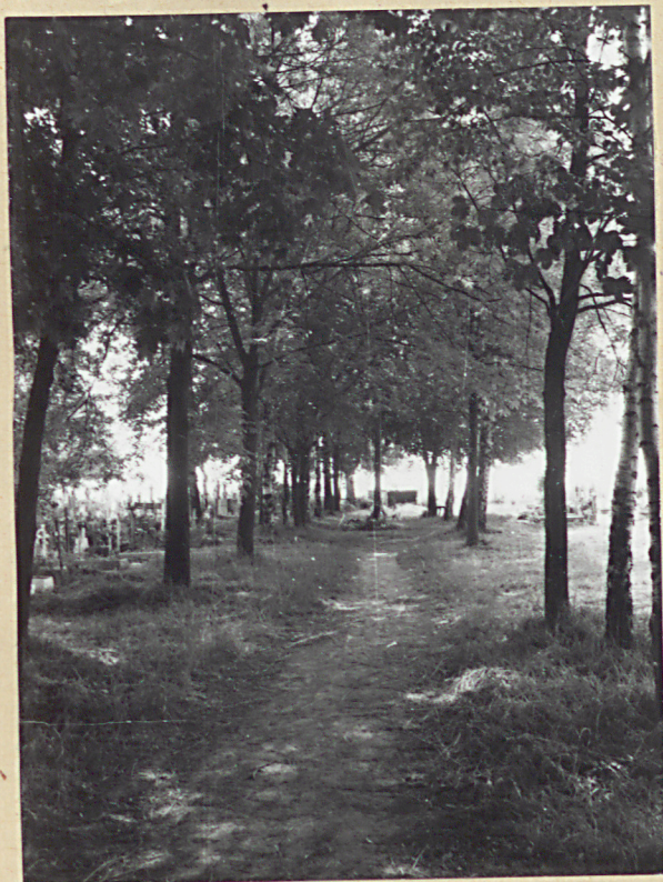
Gościno, cm. komunalny 1. Aleja główna