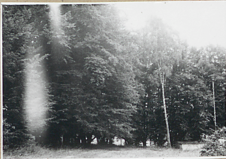
2. Porośnięty trawą teren cmentarza