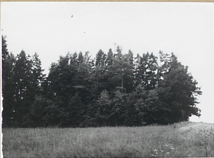
1. Widok na cmentarz od strony półn.-wsch.