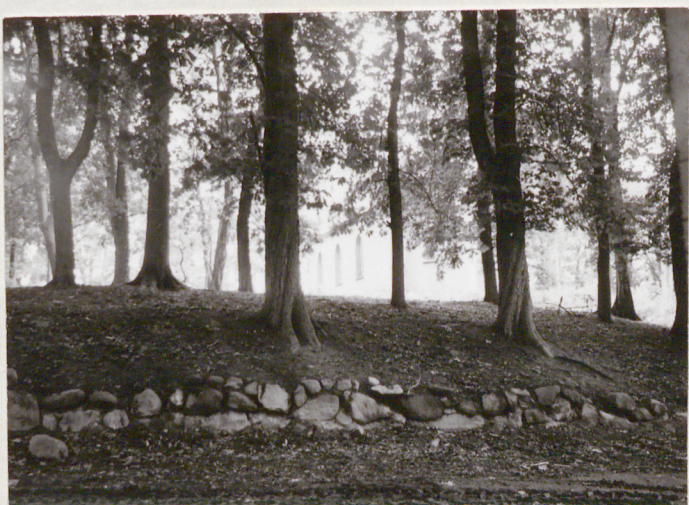
1. CMENTARZ I KOŚCIÓŁ