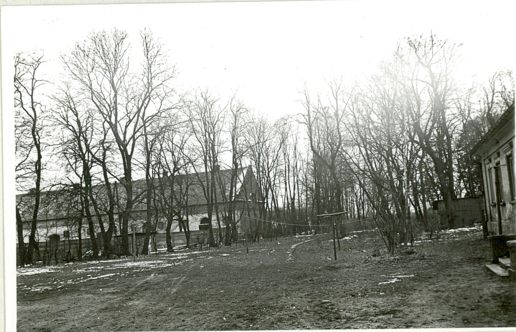
Fot. 4. Fragment parku: część żywopłotu grabowego.