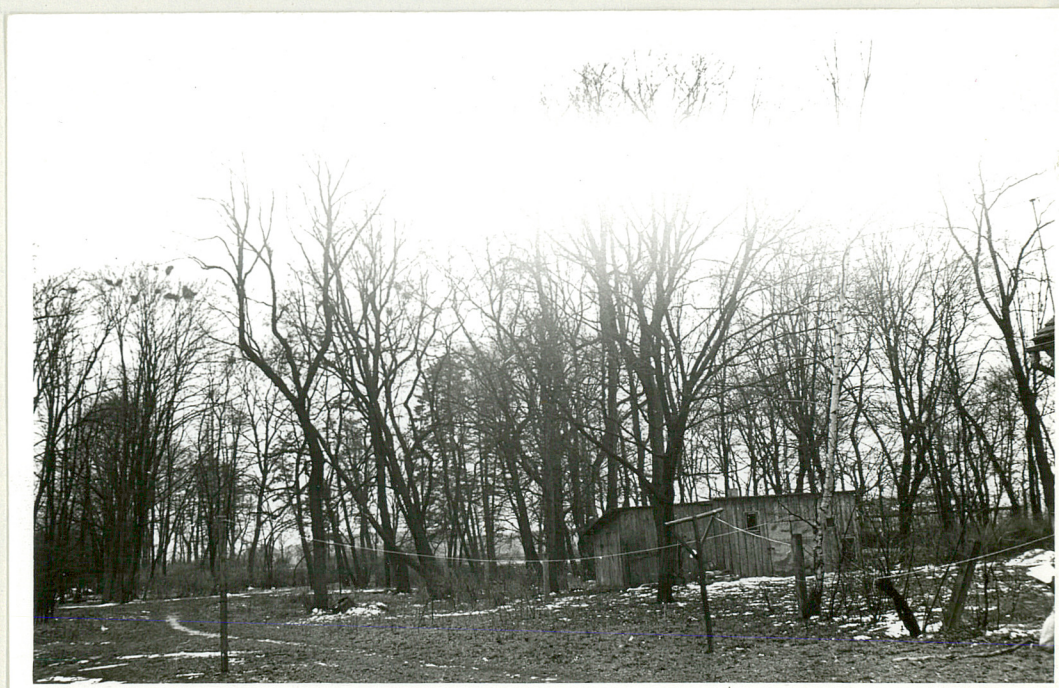
Fot. 6. Chlewiki. 1. 04. 1977