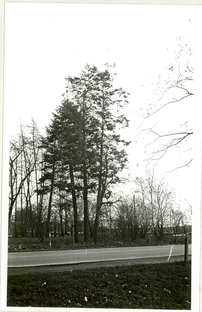
Fot. 10. Fragment parku.