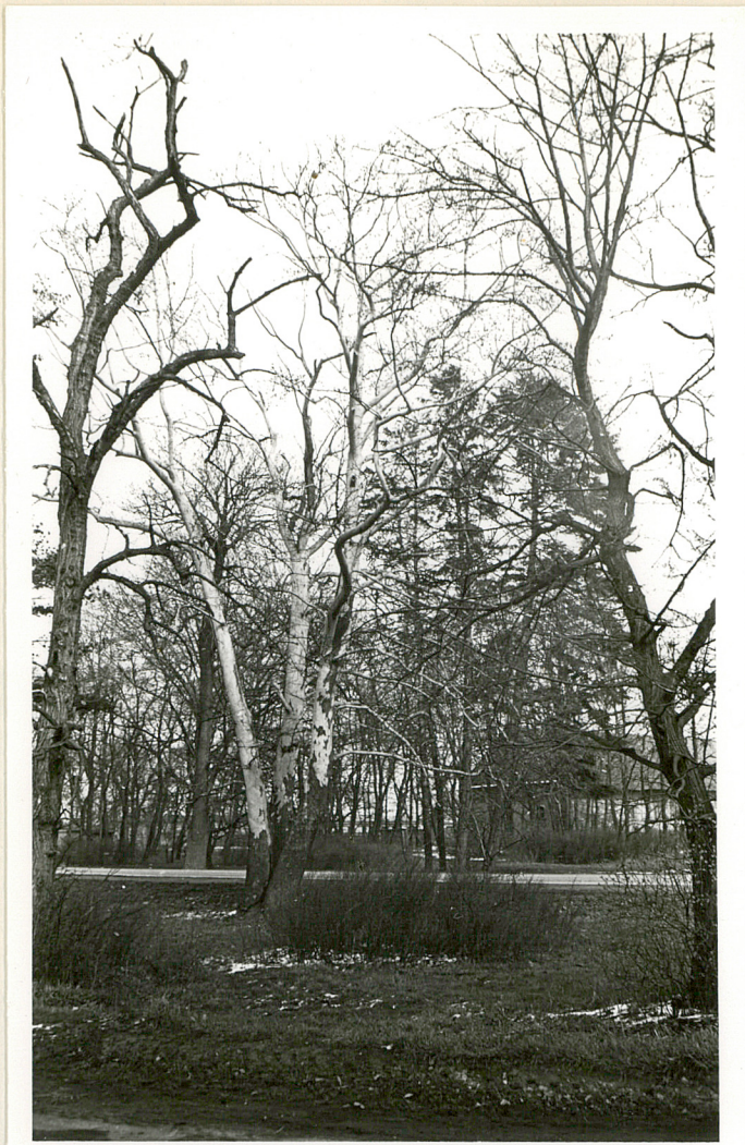
Fot. 13. Platanus acerifolia platan klonolistny.