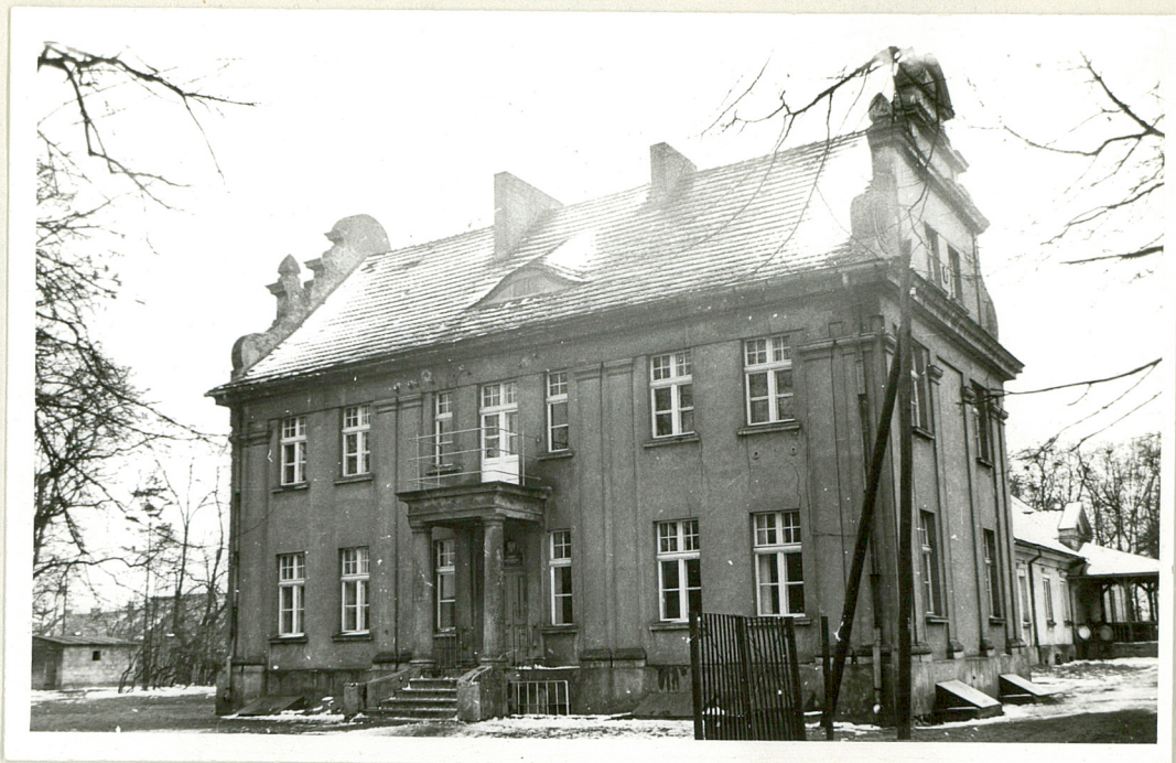
Fot. 1. Widok pałacu z frontu.