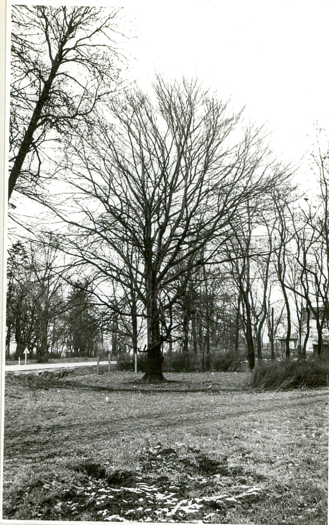
Fot. 7 i 8. Fragmenty drzewostanu w parku