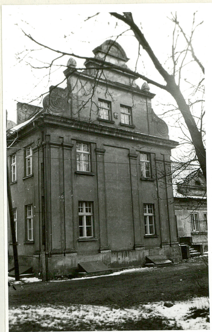
Fot. 3. Bielana szczytowa