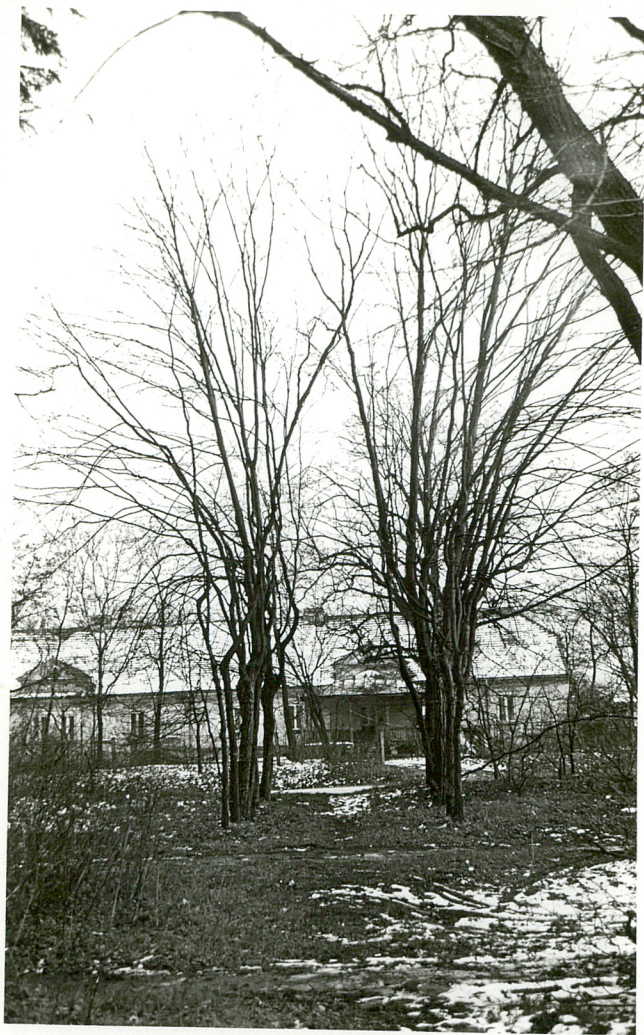
Fot. 11. Quercus robur