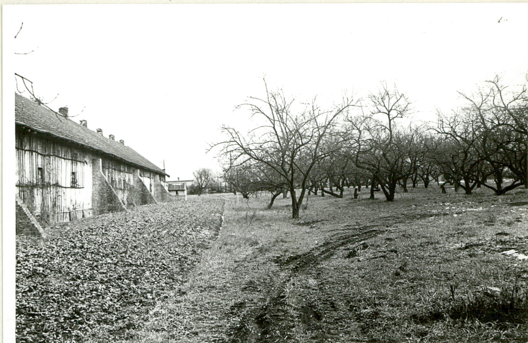
Fot. 5. Sad. 1. 04. 1977