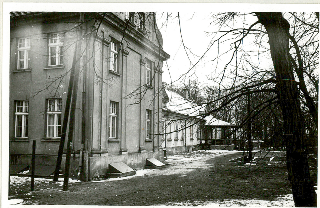
Fot. 2. Widok skrzydła pałacu w Malinów.