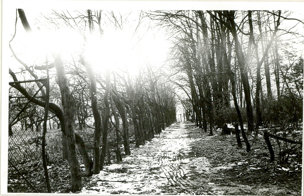
Fot. 9. Aleja grabowa.