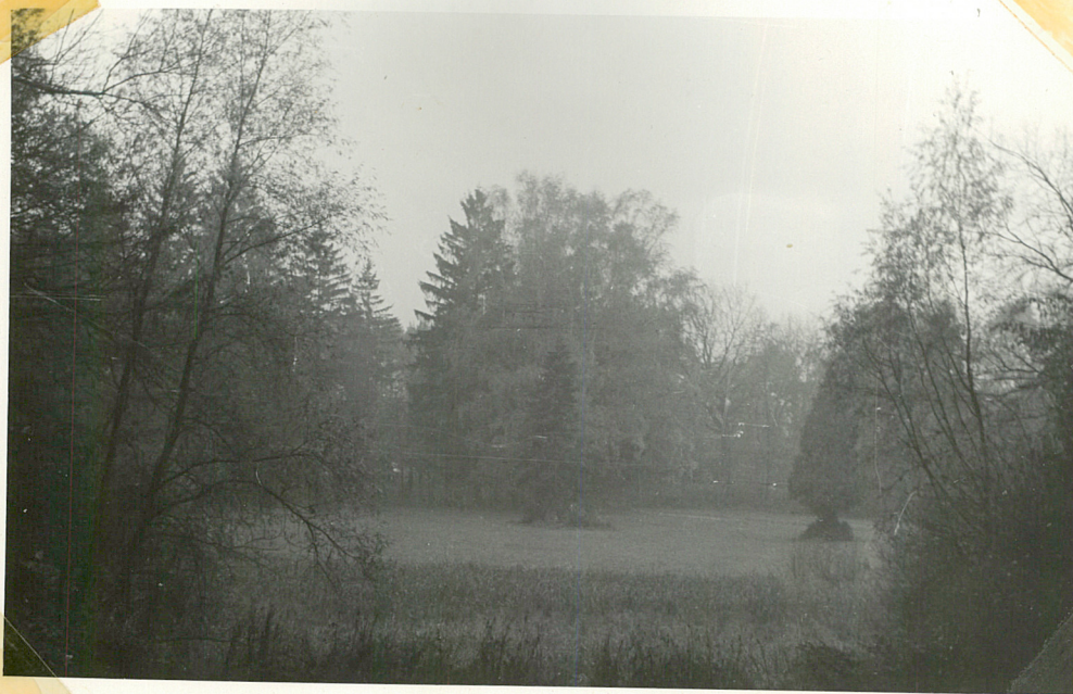
Fot.3 Polana w południowej części parku /Fotografia została zrobiona z mostku na głównej alei dojazdowej od połud. strony parku/.