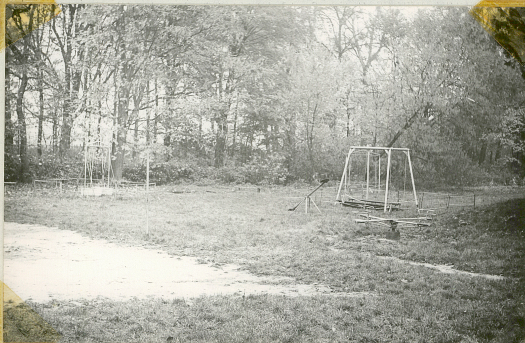
Fot.10 Plac zabaw przed frontonem pałacu.

Usytuowana w otoczeniu pałacu geometryczna część parku, skomponowana w formie regularnych trawników z klombami kwiatów nie jest obecnie wykorzystana zgodnie z pierwotnym przeznaczeniem. Obszerne trawnik naprzeciw frontonu pałacu wykorzystany jest na plac zabaw dla dzieci. Natomiast trawnik usytuowany za pałacem od strony tarasu zachował swój dawny kształt i utrzymany jest w dość dobrym stanie.