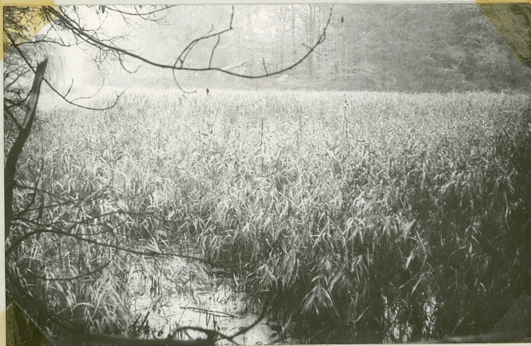
Fot.9 Obecny wygląd stawu w parku /fotografię wykonano z mostku na głównej drodze w południowej części parku./.

Piękny staw o bogato rozezłankowanych brzegach będący niegdyś starannie utrzymany, stanowi scharmonizowaną całość z resztą parku. Współcześnie staw jest bardzo zaniedbany, prawie cały zarośnięty roślinnością wodną a jego brzeg jest porośnięty olszą i wierzbą, także że lustro wody widoczne jest tylko na niewielkiej powierzchni.