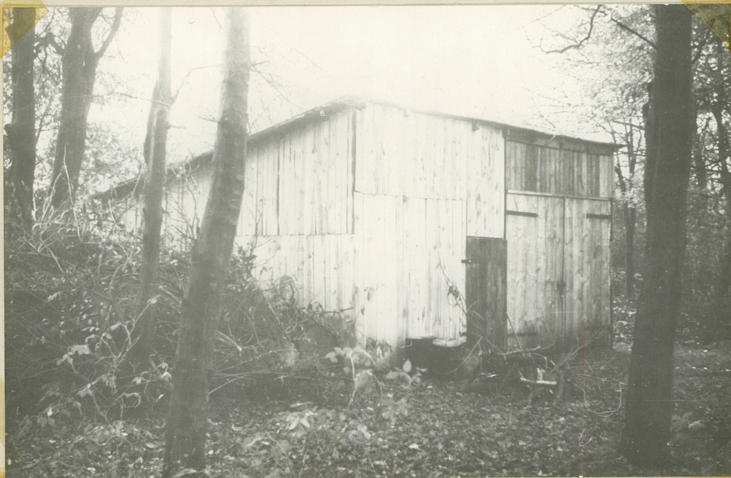
Pot. 11 Drewniany budynek magazynu.