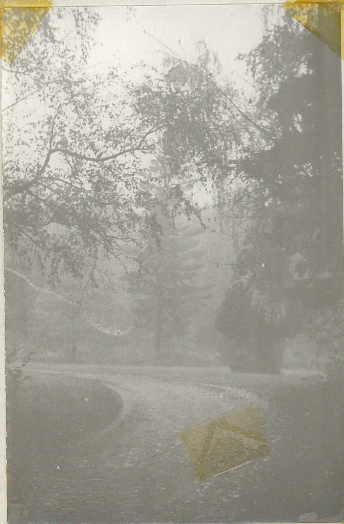
Fot. 6 - Główna aleja dojazdowa od strony południowej.