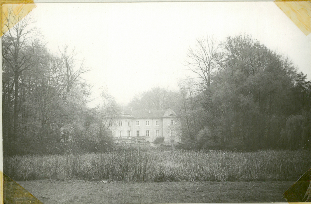
Fot.4 Widok pałacu z polany w południowej części parku.

Poszczególne części parku oraz park z otaczającym krajobrazem łączą liczne perspektywy widokowe. Dopełnieniem całości jest duży, sztucznie utworzony staw o nieregularnie uformowanej linii brzegowej.