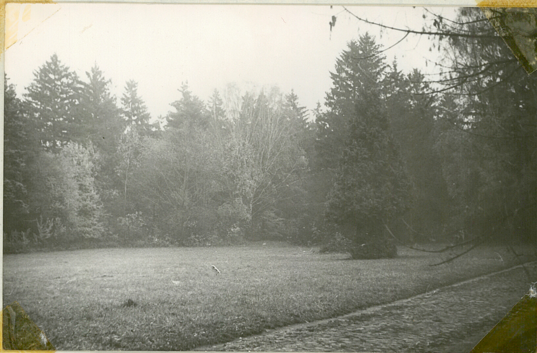
Pot. 8 Żywotnik zachodni rosnący na polanie w południowej części parku przy głównej alei.

Oprócz pojedynczych drzew występujących na przestrzeniach otwar- tych znajdują się w parku duże skupiny o charakterze zwartego drzewostanu, którego procentowy skład gatunkowy podano poniżej.