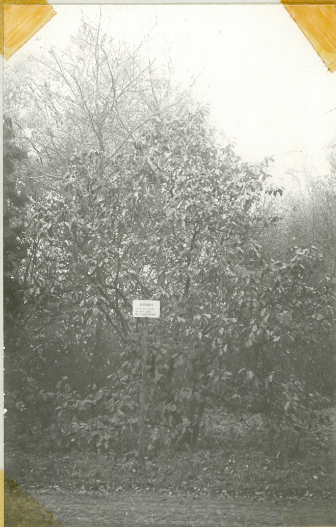
Fot.7 Jedyne rosnący w parku egzemplarz magnoli

Na drzewostan parku składają się głównie gatunki krajowe choć nie brak również wielu obcego pochodzenia.