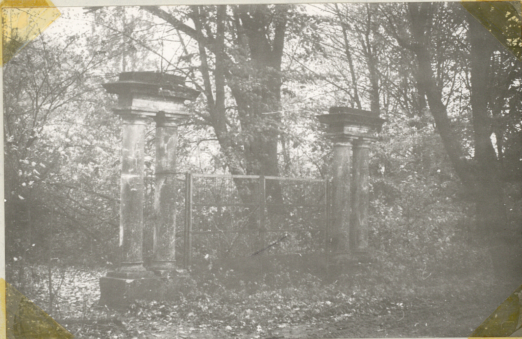
Fot. 5 - Brama wjazdowa do parku od strony północnej.