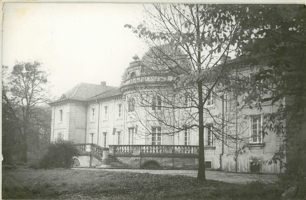
Fot. 1 Pałac w Górznie /Fotografię zrobiono z trawnika znajdującego się przed tarasem pałacu/.

Park w Górznie ukształtowany został w formie parku krajobrazowego. Nieduża część parku w najbliższym otoczeniu pałacu skomponowana jest w formie geometrycznego trawnika z kwietnikami i symetrycznie rozmieszczonymi drzewami.