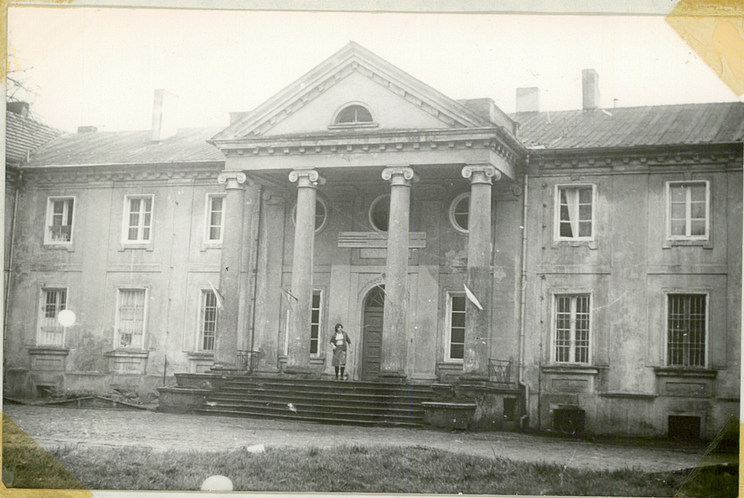
Fot.2 Pałac w Górznie /Fotografia została zrobiona z trawnika znajdującego się przed frontonem pałacu/