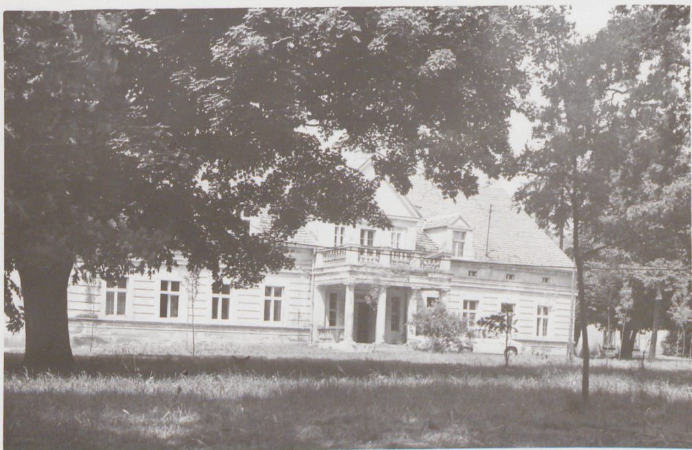
Fragment parku w Czarnotkach z widokiem na pałac.