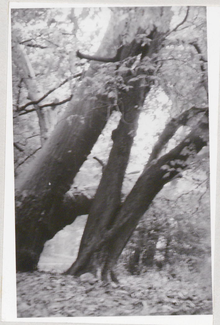
Fragment xrostu kasztanowca x platanu.