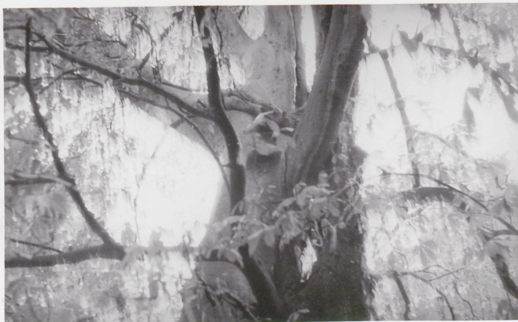
Młocia xrostów platanu i karstauowcem.