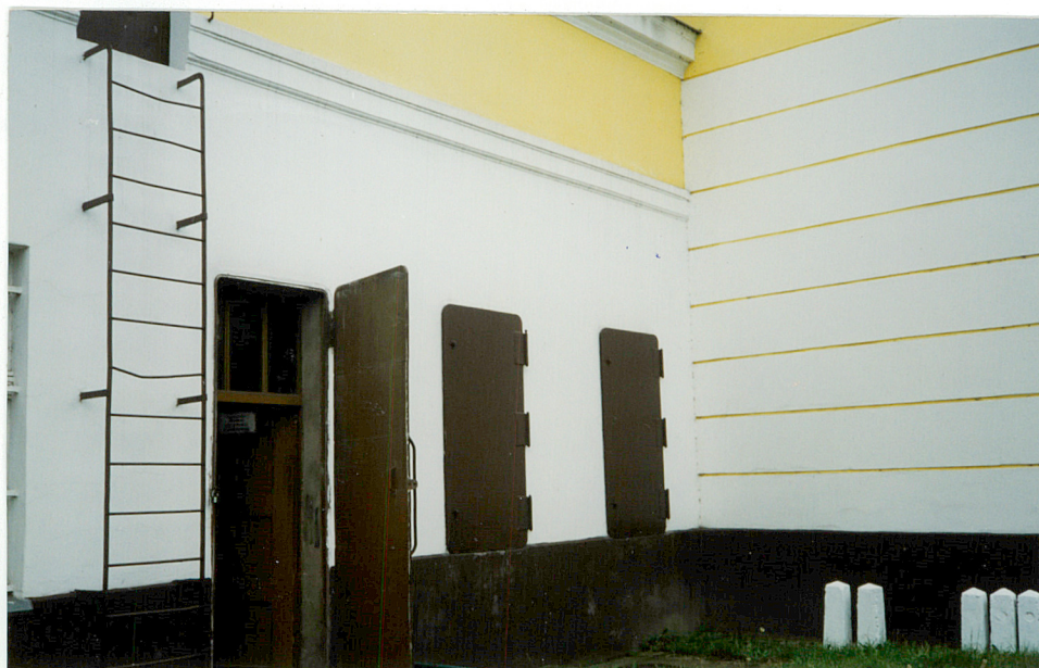
6. Elewacja ptn., fragment neg. 1100/155/5