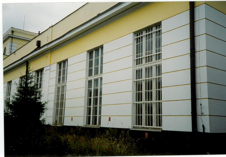
5. Elewacja pld., skrzydło zach., fragment neg. 1100/152/5