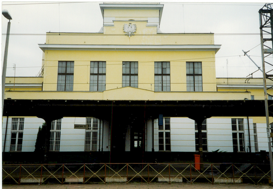
4. Elewacja pld., ryzalit środkowy, neg. 1100/154/2