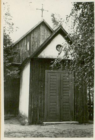
31. Salic sytuacjnnu plan schematyczny, uwagi opisowe, fotografia