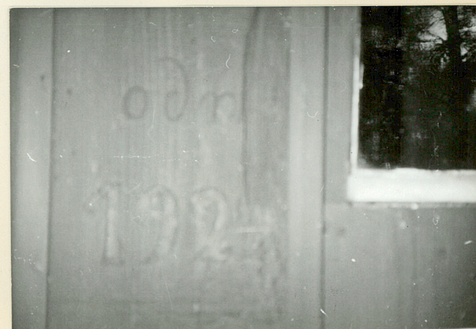
Data wyryta na ścianie- data odnowienia kościoła