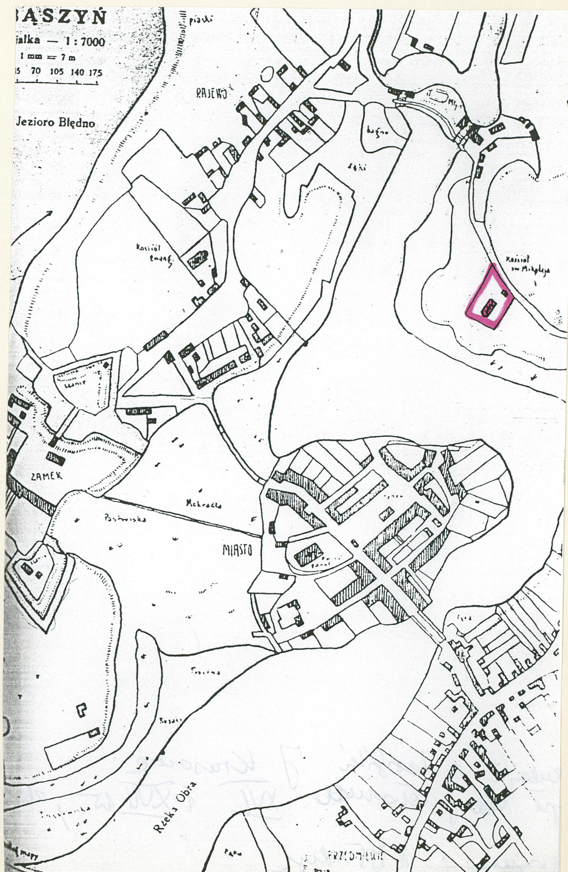
Plan Zbąszynia z 1795r. - reprodukcja z książki J. Krasonia "Zbąszyń do przełomu XVI i XVIIw.", Zbąszyń 1935