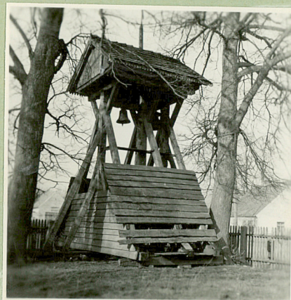
stan z 1964r.

Kościół ryglowy wypełn. cegłą, nietynkowany, salowy. Od wsch. zamknięty trzema ścianami ośmioboku, dach siodłowy. Dzwonnica drewniana w formie krosna.