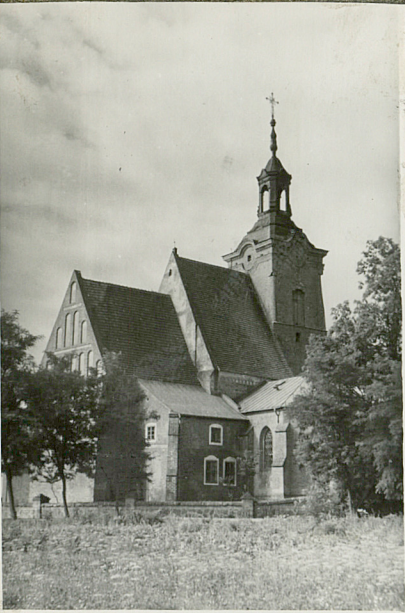
ematyczny, uwagi op