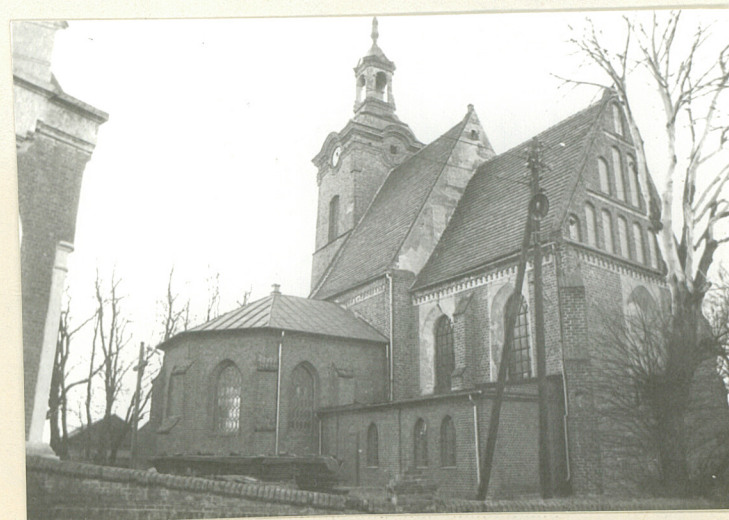
WIDOK OGÓLNY OD PN. - WSGH.

Budynek kościoła ma instalację elektryczną.