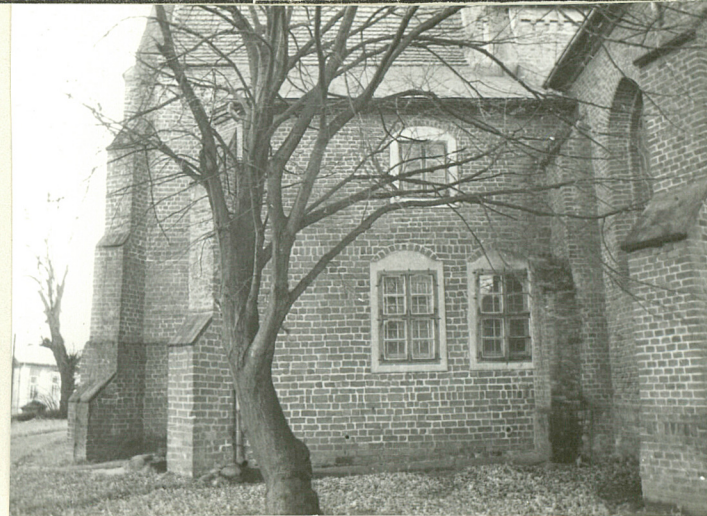
STARA ZAKRYŚCIA W ELEWACJI PN.