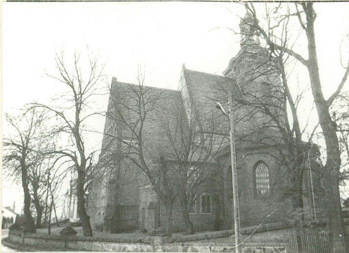
WIDOK OGÓLNY NA ELEWACJĘ PN.