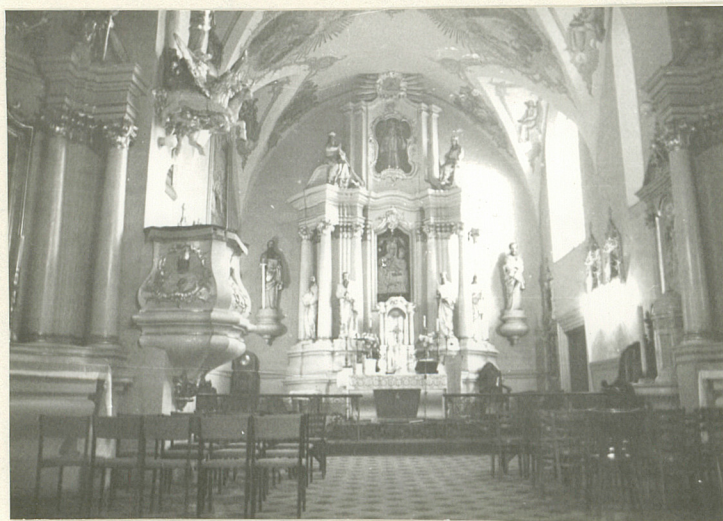
WNĘTRZE KOŚCIOŁA . OKTARZ GŁÓWNY.