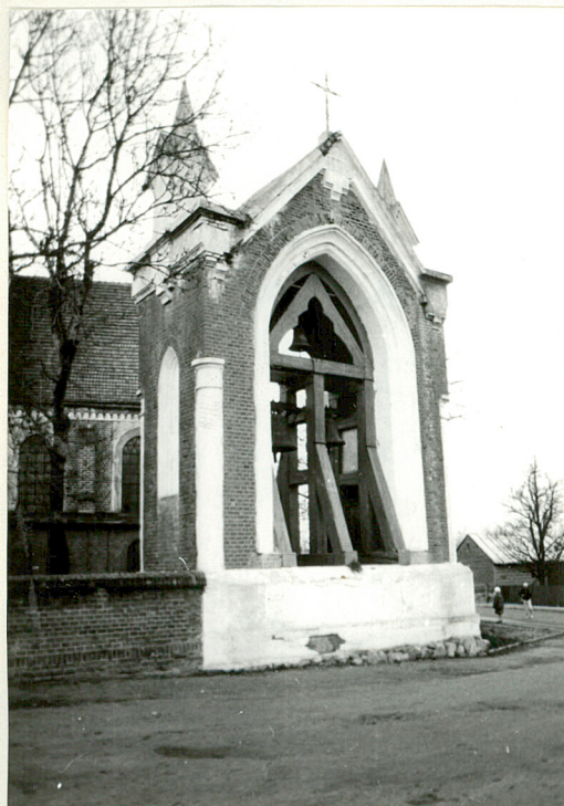
DZWONNICA. WIDOK OD PD.