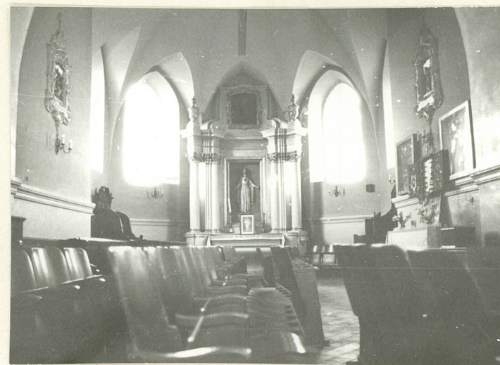
WNĘTRZE . KAPLICA PN.