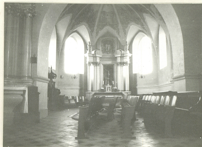
WNĘTRZE . KAPLICA PD.

OZGraf. Z.P. Ostróda zam. 699 nakł. 23.600