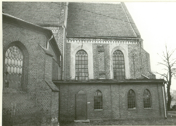
PREZBITERIUM Z NOWĄ ZAKRYŚCIĄ, ELEWACJA PD.