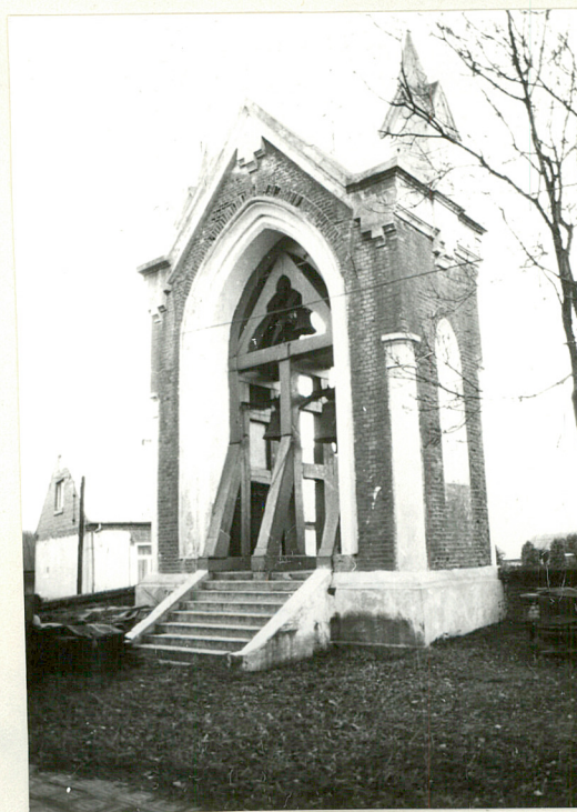
DZWONNICA. WIDOK OD PN.-WSCH.