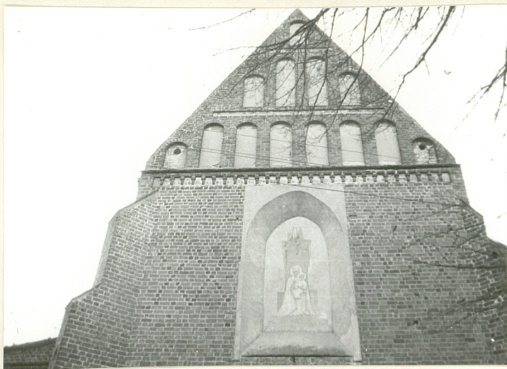
ŚCIANA SZCZYTOWA PRĘBITERIUM.