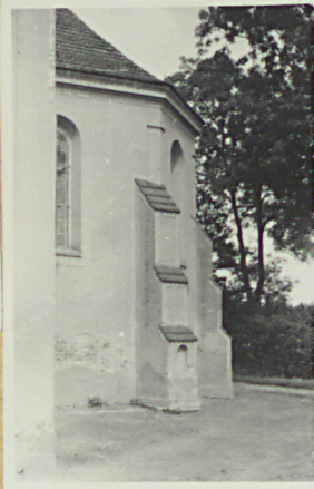
Widok ze presb.