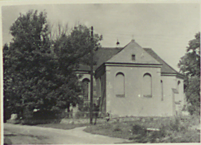
Widok od ulicy