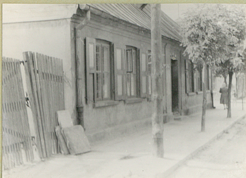
31. Szkic sytuacyjny, plan schematyczny, uwagi opisowe, fotografia