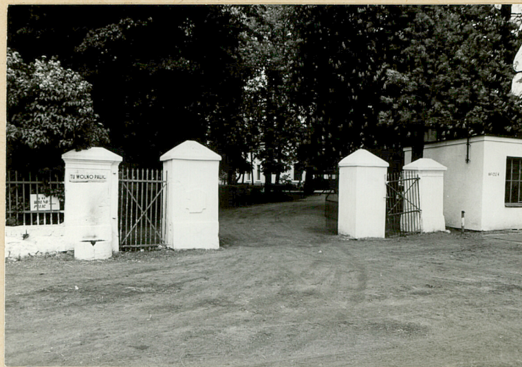
3. Brama wjazdowa na teren parku z placu folwarku. Widok z pd.