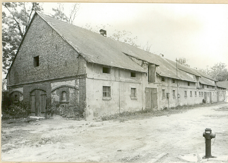
4. Chlewnia (ob. magazyn). Widok z pd.-wsch.