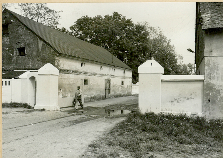
1. Brama wjazdowa na teren folwarku z szosy Konin - Wilczyn. Widok z zach.