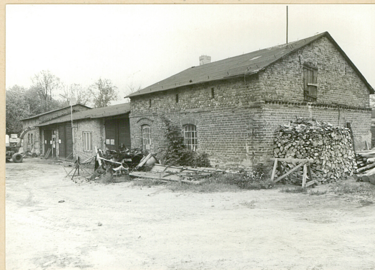
5. Warsztaty oraz magazyn narzędzi. Widok z pd.-zach.