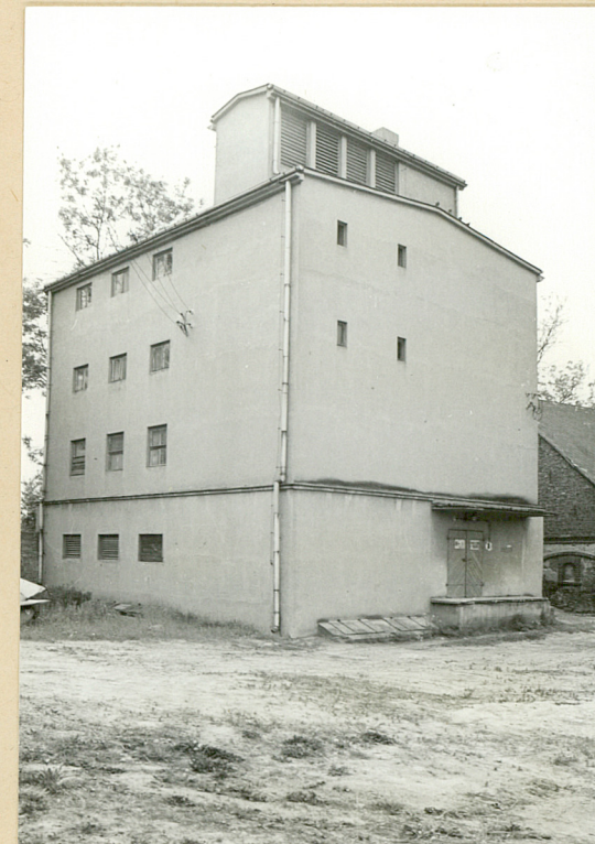
6. Magazyn chmielu ( ob. zbożowy) Widok od pd.-wsch.