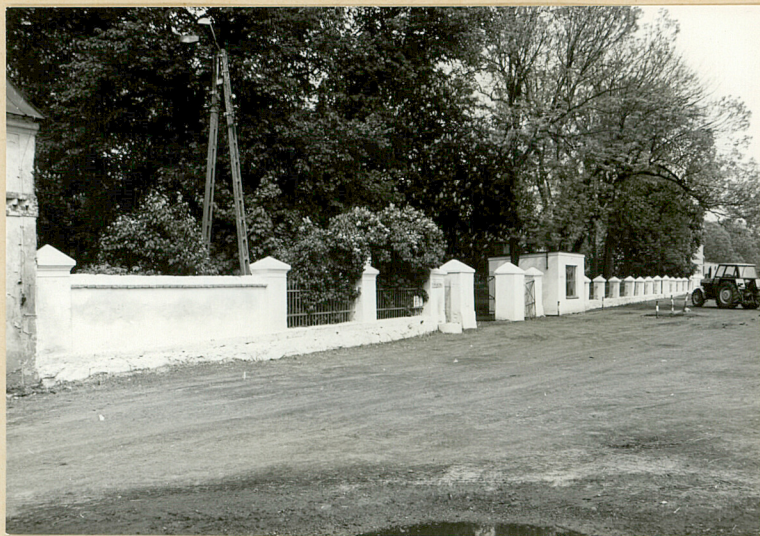
2. Ogrodzenie z bramą dzielącą plac folwarku od założenia parkowego. Widok z pd.-zach.