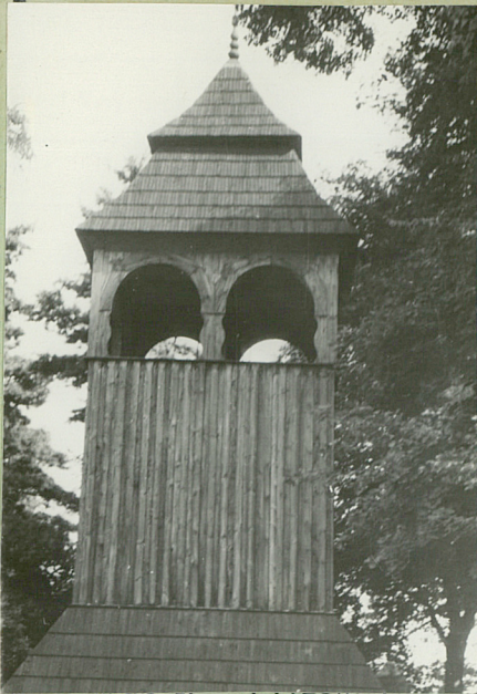
w rys. z1

Opis: Drewniana, kryta gontem - na podmurówce kamienniej. Potożona na terenie cmentarza.