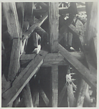
Widok na dach z wsi. Fragment więzby nad probierstnem

Orientowany. Murów z cegły o wyjm. polskim z dodatk. rendroshi. Jednoczasowy. Wodowany na murze szlacheckiego prostokąta litonę 3 postonę cyp. Wschodnie zaimię pr. bitumiu i rónie 3 postonę rónie, nasa oddzielona od prarbit. ostrołukową tęg. Od rónie pylega do rónie postonę (XV?) dołubowa nsa 8-bokowygosa. Wschodnie od pu gotyckie rónie. Po pu stronie prarbitum na- konyshia. Poniżej. nsa i nsa cewicy konyshia nsa z kletką schodów. Kuchta pd i pu nsa. nsa skrypienia gniazdote 16-to podo z rónie prarbitum spływa na piasie lipny. Od rónie nsa. Nad prarbitum prarbitum (z XV?) wysła dółbwa, nad nsa nsa, rónie w. 17-18.